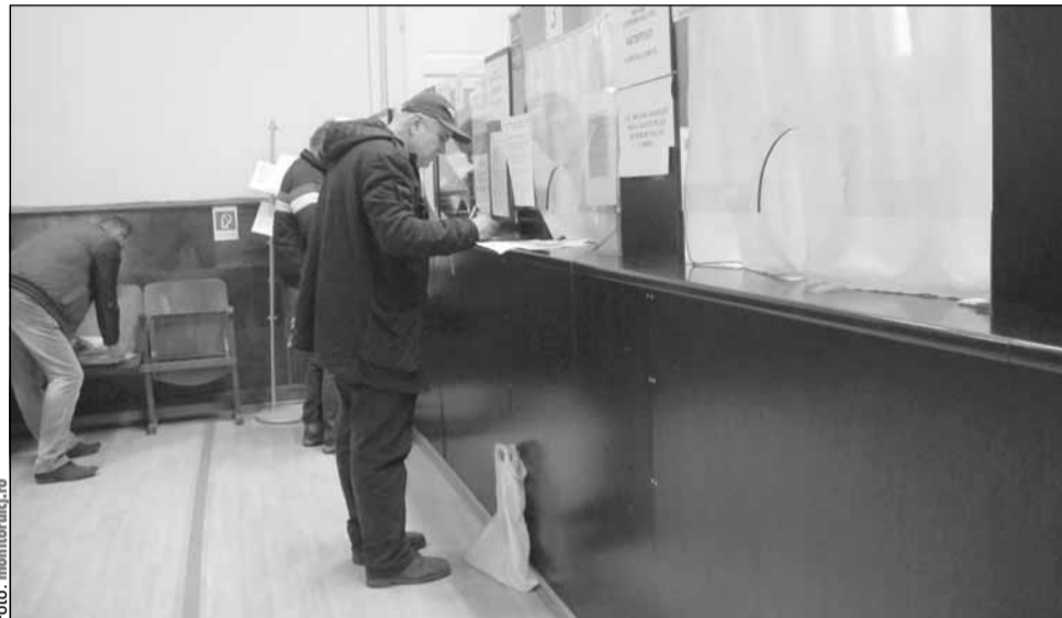
bugetarii depășesc 1,3 milioane

Măsura „înghețării” angajărilor la stat a venit prin intermediul „Ordonanței-trenuleț”, adoptate pe final de an.