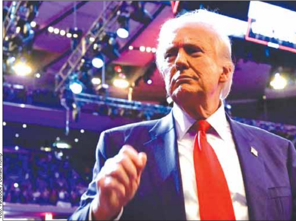
Președintele Donald Trump avertizează Europa în legătură cu taxele vamale

„Probabil este 1 februarie, asta e data la care ne uităm”, adăugat Donald Trump, care corespunde cu data anunțată