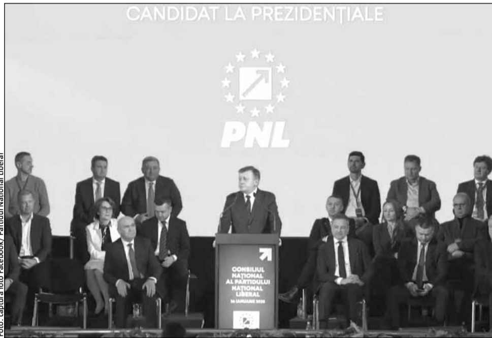
Consiliul Național al PNL a validat candidatura lui Crin Antonescu la președinția României

Crin Antonescu le-a mulțumit tuturor pentru vot și i-a solicitat președintelui in-