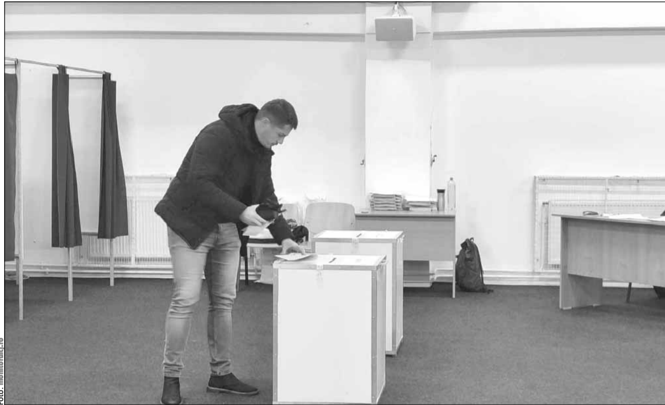
Procurorii anchetează alegerile prezidențiale din 2024

„Este investigată influențarea alegerilor, este investigată finanțarea ilicită în zona aceasta, este investigată spălarea de bani și sunt investigate și atacurile cibernetice care au supus infrastructura noastră relevantă din punct de vedere electoral unor încercări de imixtiune. Deci, există mai multe dosare, ele sunt în faza în rem”, a declarat Radu Marinescu la Digi24, precizând că doar acestea sunt informațiile pe care le are ca mi-