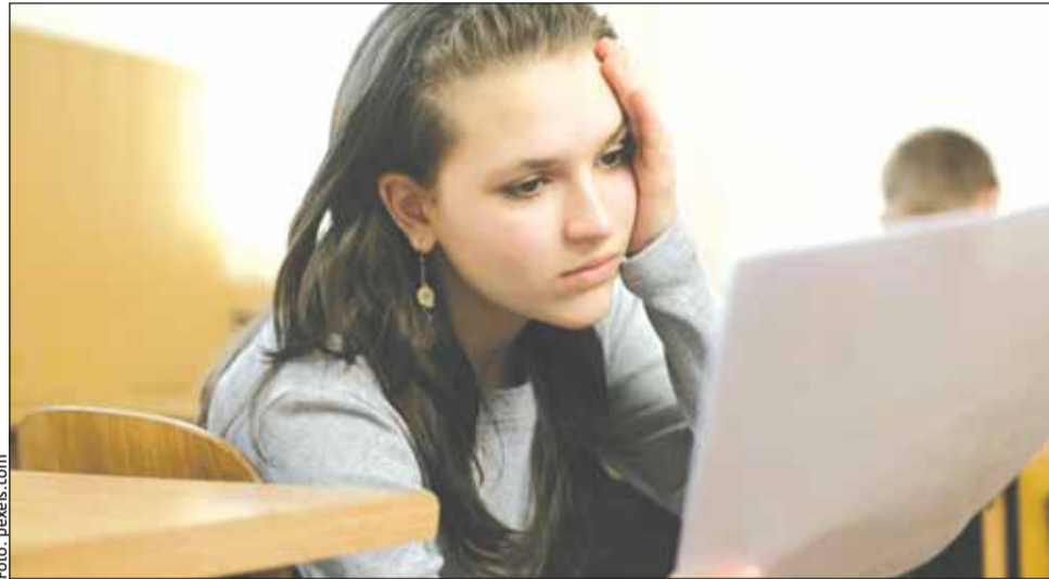
Probele de evaluare a competențelor din cadrul primei sesiuni a examenului de bacalaureat încep astăzi

Ministrul Educației, Daniel David, a transmis un