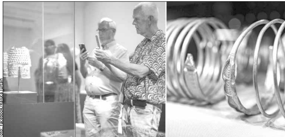
România își va recupera cele patru piese de tezaur furate, promit autoritățile

Premierul a recunoscut că furtul pieselor din tezaurul dacic reprezintă „o situație foarte gravă”. „Acest jaf care trebuie soluționat cu celeritate nu trebuie să devină combustibil pentru propagarea a tot felul de teorii ale conspirației de către cei care vor să obțină capital politic facil. Tezaurul se va întoarce în România