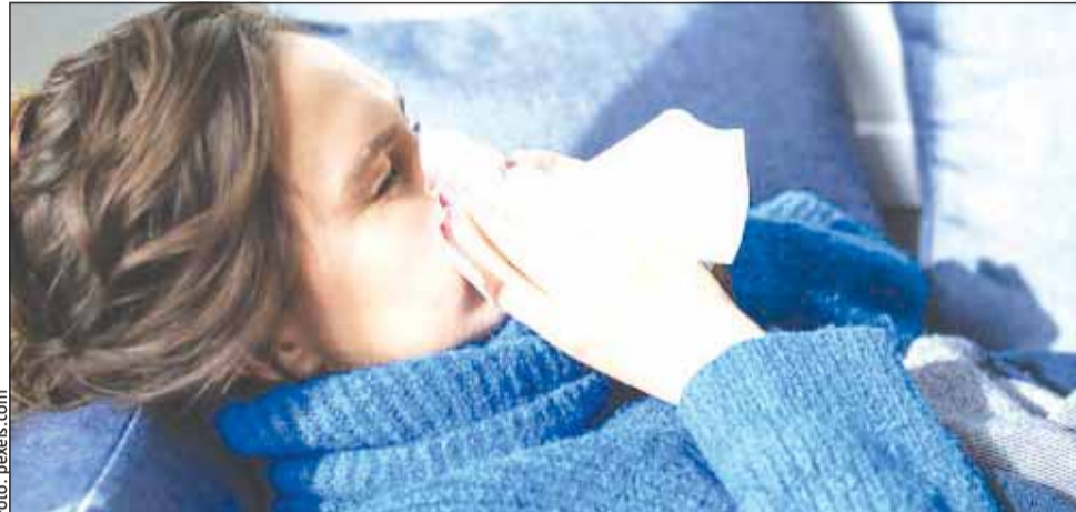
Numărul infecțiilor respiratorii a depășit 125.000 de cazuri săptămâna trecută

Numărul persoanelor care au murit din cauza gripei a ajuns la 14. „În săptămâna 13 - 19 ianuarie au fost raportate 125.452 cazuri de infecții respiratorii (gripă clinică, IACRS și pneumonii), înregistrându-se cu 1,6% mai multe cazuri comparativ cu aceeași săptămână a sezonului precedent (123.464)