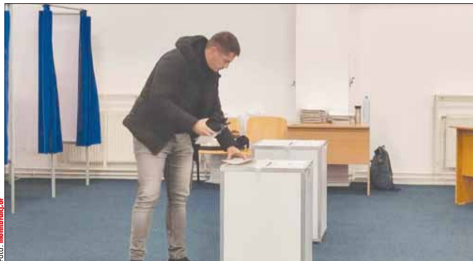
Alegerile prezidențiale vor avea loc pe data de 4 mai 2025

Potrivit acestuia, votul pe teritoriul României va avea loc în data de 4 mai, va începe la ora 7 și se va încheia la ora 21, iar alegătorii care la ora 21 se află în sediul secției de votare ori se află la rând pentru a vota își vor putea exercita dreptul