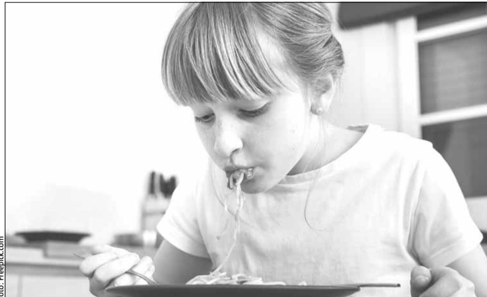
Guvernul a decis, în ședința de marți, să extindă programul „Masă sănătoasă”

„Deocamdată, mergem cu acest număr pe care l-ați auzit, peste 500.000 de beneficiari. În curând vom veni cu o altă HG pentru a detalia concret unitățile administrativ teritoriale și unitățile școlare ca-