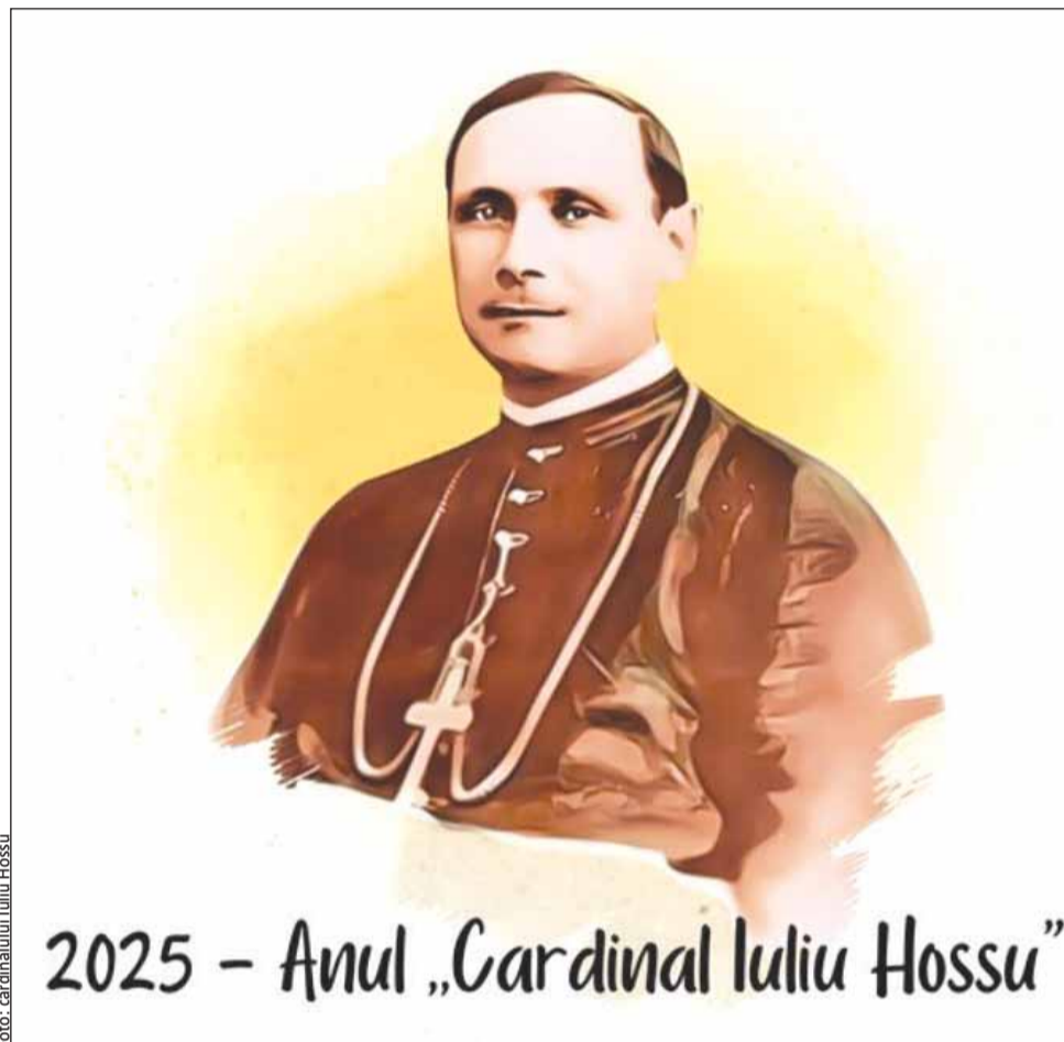
140 de ani de la nașterea cardinalului Iuliu Hossu

Încă din timpul războiului, Iuliu Hossu a devenit un înflăcărat militant pentru Unire, „un adevărat apostol al înfăptuirii unității naționale”.