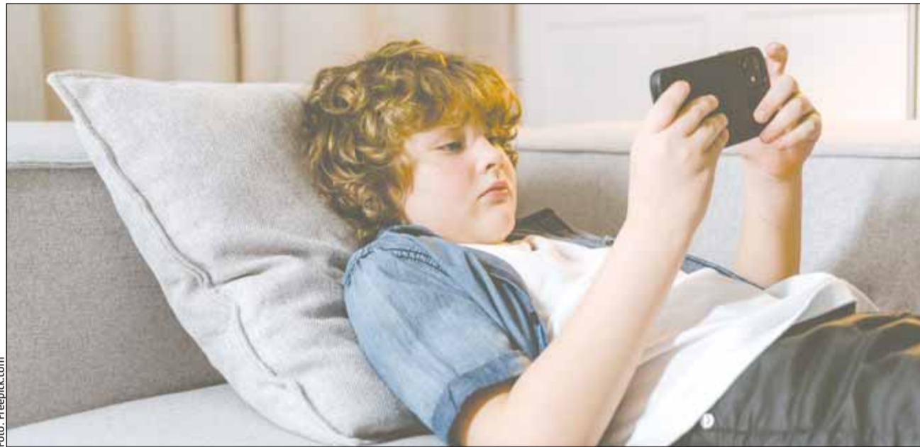
Doar 2,2% dintre elevii din clasele a III-a și a IV-a afirmă că nu au cont pe nicio platformă sau rețea socială

„Elevii de liceu și gimnaziu folosesc cel mai mult internetul pentru a comunica cu prietenii, familia sau cu alte persoane pe rețelele sociale și pentru a urmări conținut