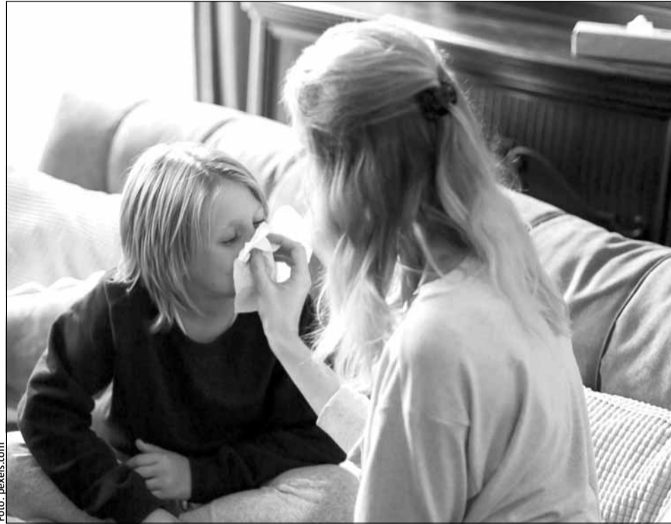
Ministerul Sănătății a anunțat introducerea stării de alertă epidemiologică

„Având în vedere succesiunea a 3 săptămâni care au evoluat cu o intensitate înaltă a activității gripale, cu depășirea mediei față de sezoanele anterioare și cu o răs-