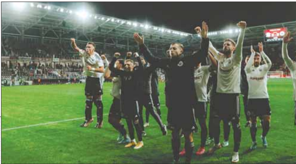
Universitatea Cluj, motivată înaintea meciului cu Rapid