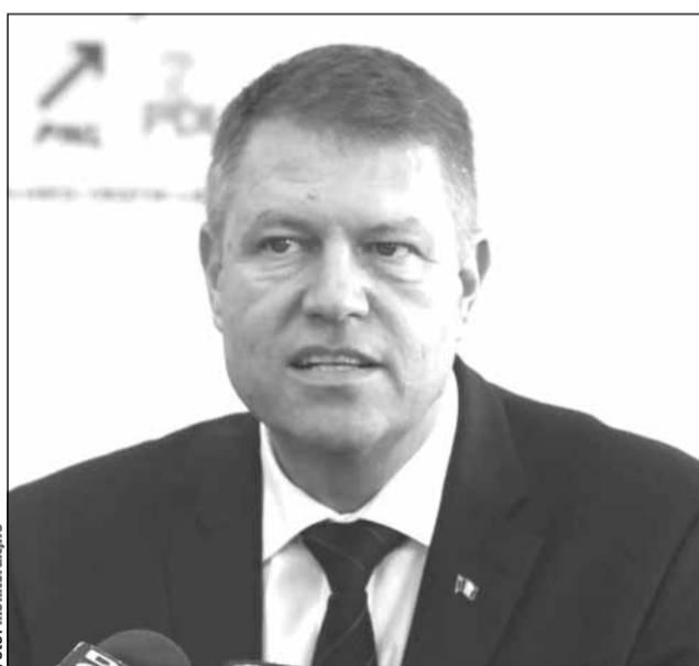
Conducerea Parlamentului a respins solicitarea POT, AUR și SOS de a-l suspenda pe președintele Klaus Iohannis

Potrivit Constituției, în cazul săvârșirii unor fapte gra-