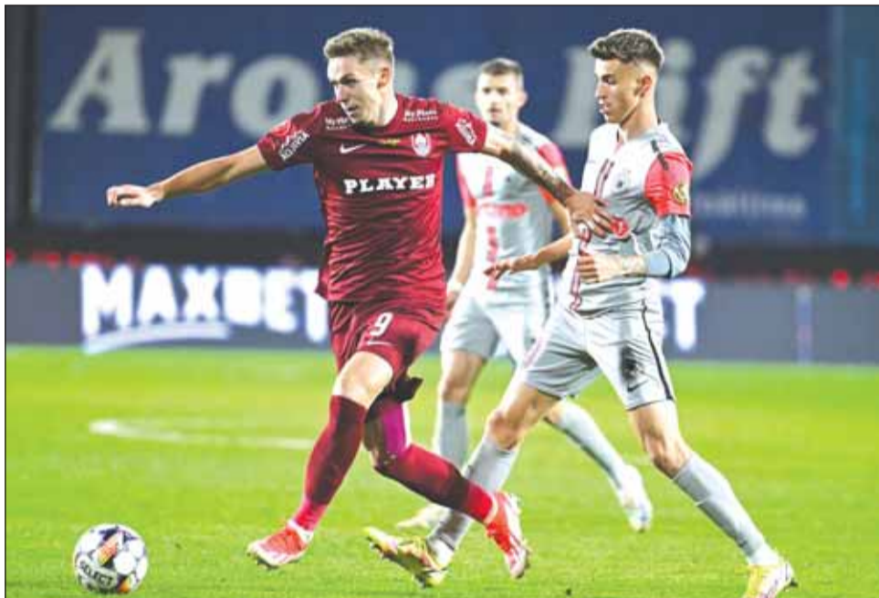
„Arena Național” a găzduit unul dintre cele mai interesante dueli din Superliga României: FCSB-Dinamo

„Va fi un meci foarte greu. Tot timpul au fost meciurile grele la FCSB. Meciuri inten-