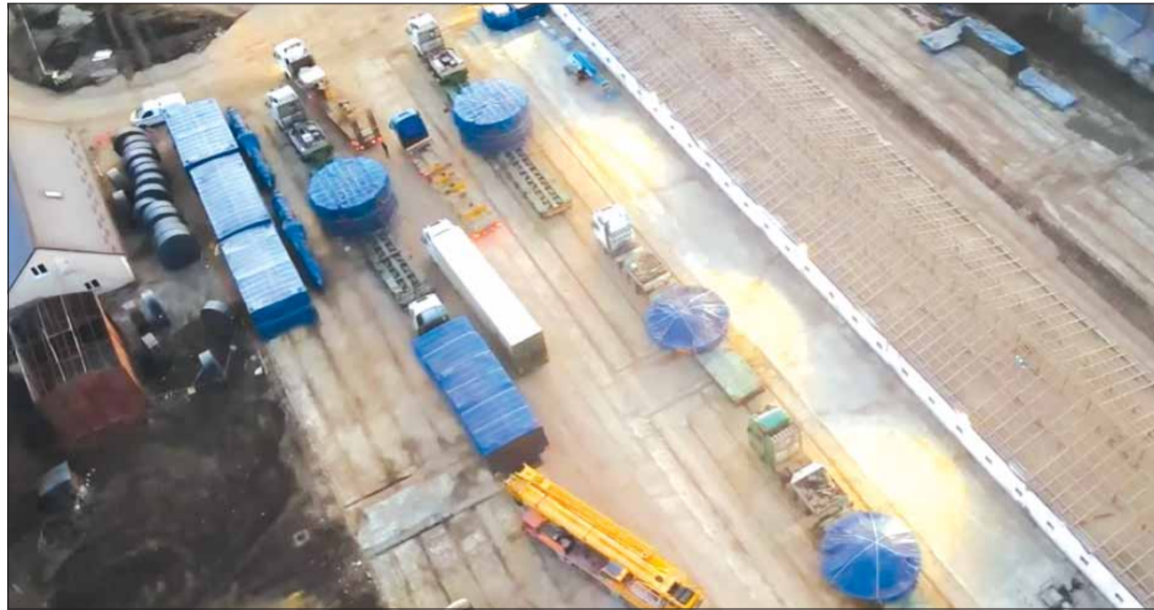
Metroul de la Cluj primește 310.000.000 lei pentru construire. „Cârțițele” care vor săpa tunelul pentru metrou au ajuns la finalul anului la destinație.

Veniturile bugetului consolidat sunt estimate la