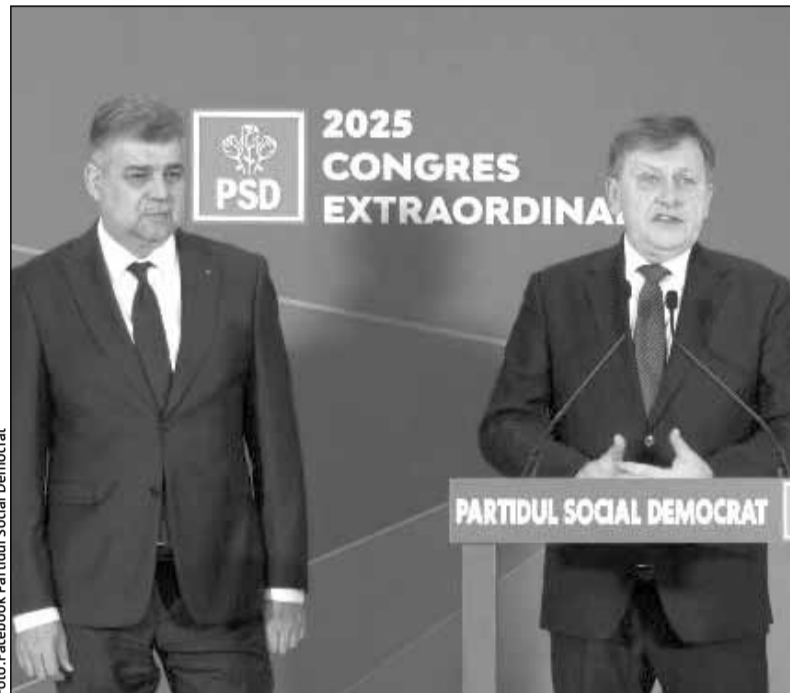
Congresul PSD a validat candidatura lui Crin Antonescu la alegerile prezidențiale din 4 mai

„Asta poate fi începutul unei frumoase prietenii. În cazul nostru e puțin altfel, povestea e ceva mai interesantă, ceva mai spectaculoasă și tot ce îmi doresc, nu doar pentru noi, ci pentru țara noastră, e ca această lungă și complicată poveste să aibă happy end. Happy end înseamnă o Românie stabilă, cu un raport, în fine, normal, du-