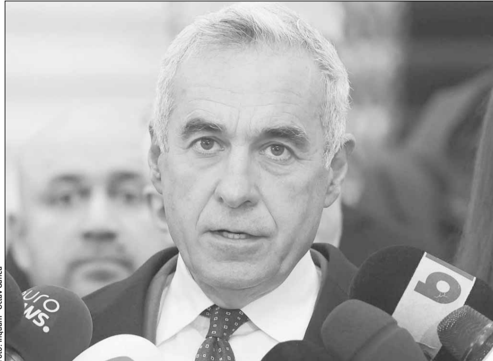
Curtea Constituțională ar putea respinge candidatura lui Călin Georgescu la alegerile prezidențiale