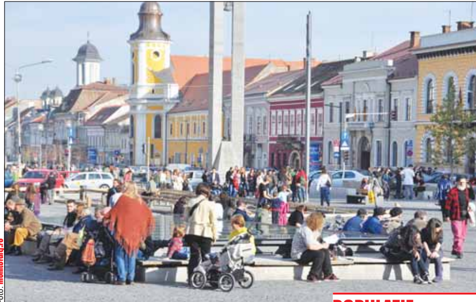
Clujul avea anul trecut peste 744.000 de persoane

Populația după domiciliu reprezintă populația de jure care poate să includă și emigranții, respectiv cetățea-