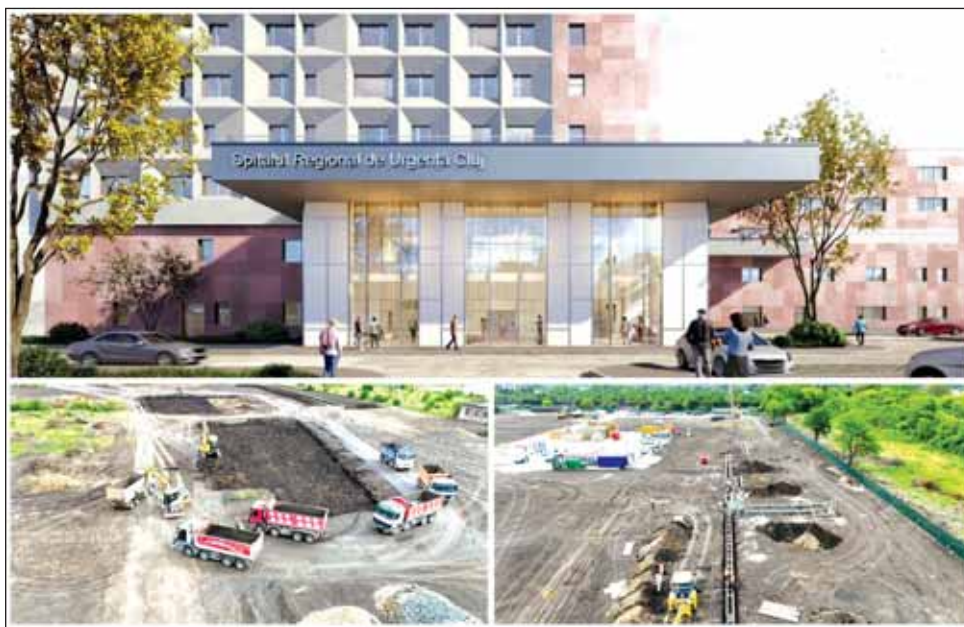
Lucrările la Spitalul Regional de Urgență din Cluj, care se ridică în Florești, au început anul trecut. Spitalul Regional de Urgență, un proiect fanion, pe domeniul sănătății al Clujului are bani asigurați.

Bucureștiul se află la 3.95% iar media națională, puțin în creștere de luna trecută, este la 4.47%, potrivit datelor aferente lunii ianuarie.