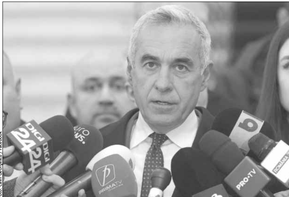
Călin Georgescu are un dosar penal deschis de Poliție și Parchet pentru afișele electorale ilegale

Ministerul Afacerilor Interne (MAI) a transmis că atribuțiile structurilor sale în organizarea și derularea alegerilor sunt strict delimitate. La sesizarea Autorității Electorale Per-