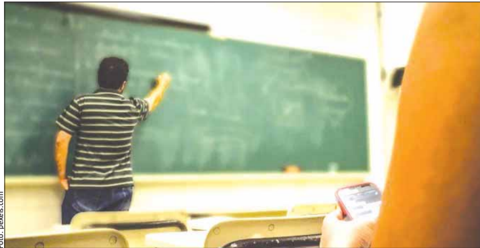
Peste o treime dintre elevii din România sunt afectați de analfabetismul numeric

„Elevii din mediul rural prezintă cele mai ridicate niveluri