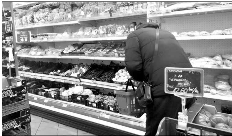
România, țara din UE cu cele mai mici prețuri la produse alimentare. Manipularea online a demagogului Georgescu.

„Este nevoie ca noi, poporul, prin deciziile noastre să ajungem să ne reglăm costurile atât în piața agroalimentară cât și în piața energiei,