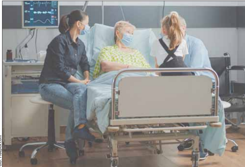
Cancerul, una dintre principalele cauze de mortalitate în România

„Decalajul dintre mortalitatea evitabilă din România și media Uniunii Europene se reflectă nu numai la nivelul