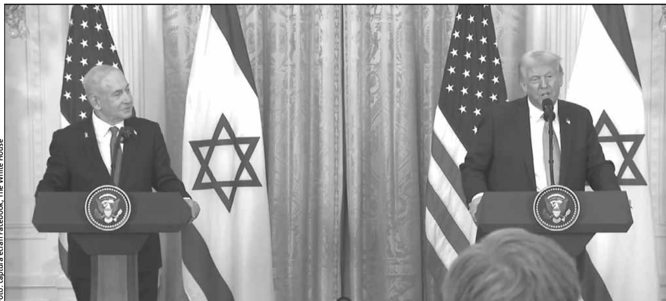
Planul președintelui american Donald Trump ca Statele Unite să preia controlul asupra Fâșiei Gaza și să o transforme economic stârnește temeri în lumea arabă

Situația este și mai delicată acum, când peste 85% din cei 2,3 milioane de locuitori ai Gazei au fost deja forțați să-și părăsească locuințele din cauza bombardamentelor israeliene. ONU consideră Gaza una dintre cele mai dens populate zone din lume.