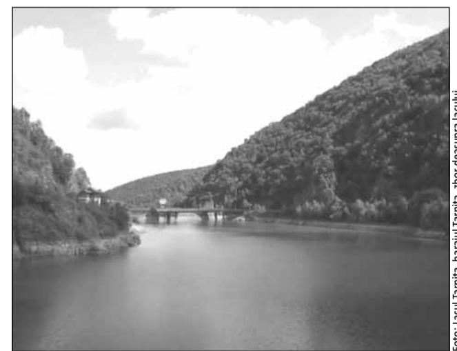
Lacul Tarnița, barajul Tarnița, zbor deasupra lacului, 2021

„Sunt discuții pe marginea proiectului centralei hidroelectrice cu pompaj Tarnița. Domiciliul ministru Burduja susține foarte mult acest proiect, iar acum două săptămâni am avut o întâlnire cu o echipă de consultanți pe această temă. Au venit la noi, la Dispeceratul Energetic Național să ia date despre acest proiect. Urmează și alte discuții, sperăm să deschidem calea acestui proiect de mare anvergură, care este necesar”, a declarat șeful Dis-