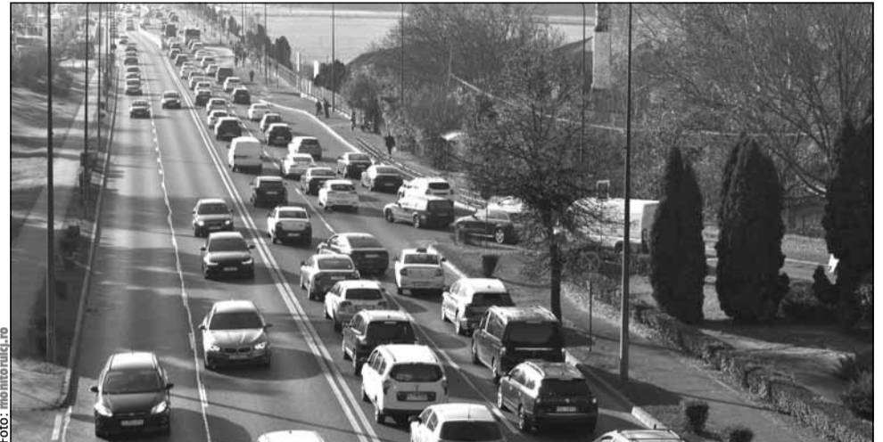
Taxa auto pentru mașinile cu emisii ridicate revine în România

„Dacă va exista o nouă taxă, va fi implementată în felul următor: va fi discutată cu Comisia Europeană și vom strânge toate know-how-urile (informațiile) și toate exemplele pozitive din Uniunea Europeană, astfel încât să nu mai