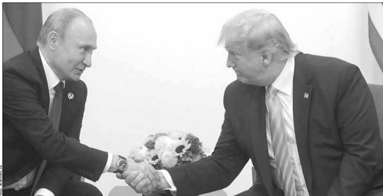
Președintele american Donald Trump a declarat că a vorbit la telefon cu președintele rus Vladimir Putin despre o încetare a războiului din Ucraina

Vineri, Trump a declarat că probabil se va întâlni sâmbătă