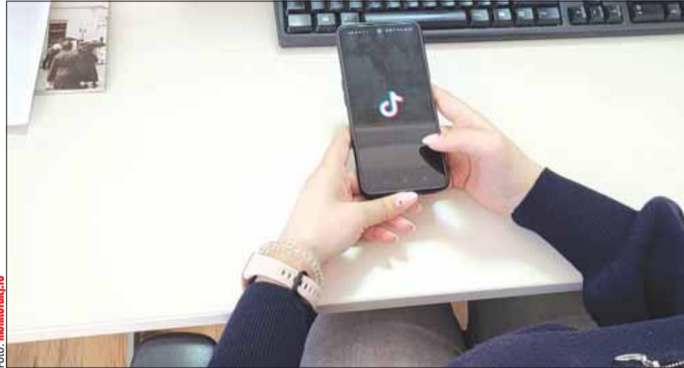
Mai mult de 8 din 10 adolescenți care au TikTok accesează zilnic platforma

„Peste 84% dintre adolescenții cu vârste între 14 și 19 ani care au cont de TikTok accesează platforma zilnic, iar peste jumătate dintre aceștia (53,4%) accesează platforma de mai mult de patru ori pe zi. În medie, tinerii petrec în jur de două ore jumătate pe platformă, iar deschiderea unui cont se face în jurul vârstei de 13 ani. Mai mult de 4 din 10 tineri (41,6%) nu verifică informația furnizată pe TikTok, iar 1 din 10 tineri și-a pus un diagnostic al unei probleme psihologice în urma vizionării conținutului de pe platformă”, se arată într-un comunicat transmis, ieri, de organizație.