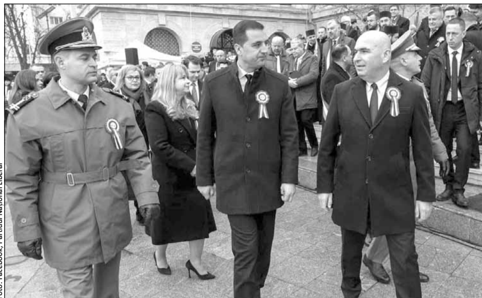
Curtea Constituțională a stabilit ca Ilie Bolojan (dreapta) să preia din 12 februarie interimatul la Palatul Cotroceni

Instanța constituțională a constatat că vacanța funcției de Președinte al României este „o împrejurare care justifică interimatul” în exercitarea funcției de președinte al României, începând cu data de 12 februarie 2025.