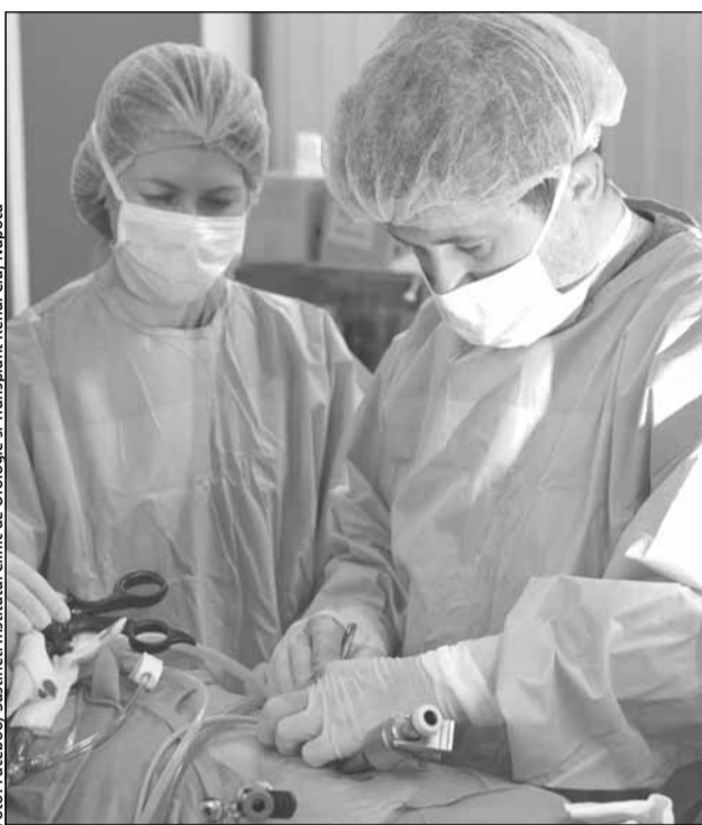
Sustineti Institutul Clinic de Urologie si Transplant Renal Cluj-Napoca

El a precizat că pe lista de așteptare de la ICUTR figurează 2.477 de pacienți pentru transplant, însă, din diverse motive, în special religioase,