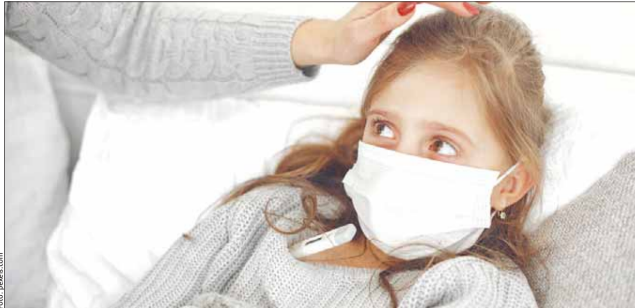
Sute de copii au ajuns la urgențe, diagnosticați cu gripă

„Din păcate, numărul mare de pacienți care se adresează direct Unității de Primire a Urgențelor duce la aglomerarea excesivă a acesteia, ceea ce favorizează transmiterea infecțiilor respiratorii, într-o perioadă în care gripa și răceala sunt în creștere. În acest context, în situația în care starea copilului este gravă, părinții sunt îndemnați să se adreseze unităților spitalicești. Dacă, însă, starea copilului este bună, părinții sunt rugați să apeleze serviciul non-stop de telemedicină AlopEDI, medicul de gardă putând, după o evaluare a gravității stării copilului, să furnizeze sfaturile necesare privind îngrijirea la domiciliu a copilului”, trans-