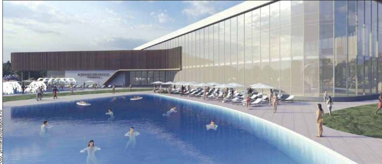
Consiliul Local Cluj-Napoca a aprobat Planul urbanistic zonal pentru Aquapark-ul din cartierul Grigorescu

Aquapark-ul din Grigorescu ar putea fi realizat printr-un parteneriat public-privat. Nu este prima dată când primarul Emil Boc a vorbit despre o a-