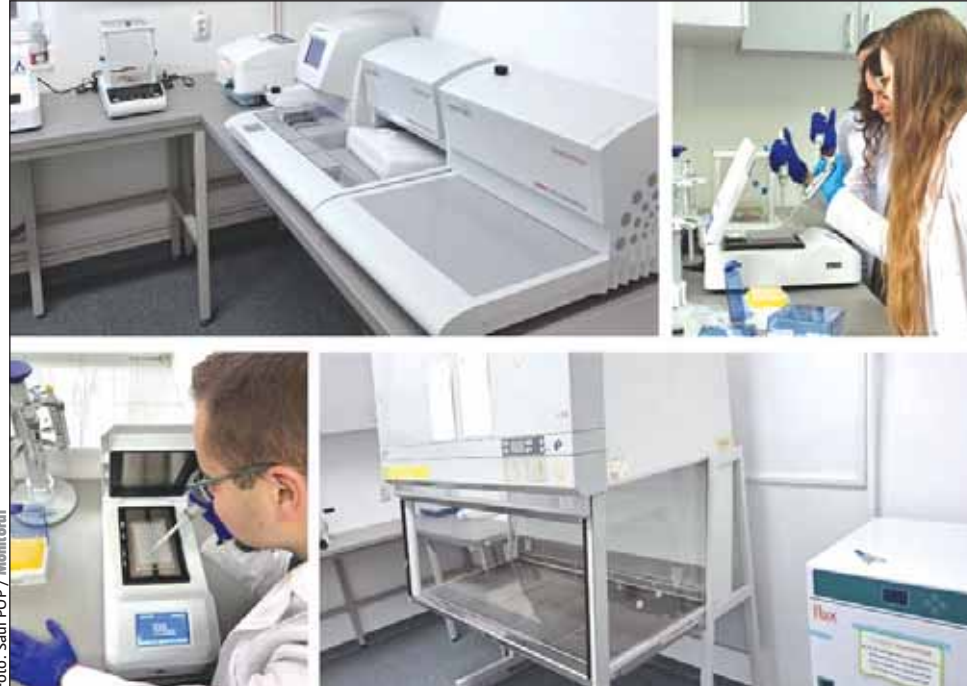
UBB și Terapia aduc tehnologia din industria farmaceutică în mediul academic clujean

Această inițiativă subliniază rolul important al colaborării dintre mediul academic și companiile de top în pregătirea viitorilor specialiști. Într-un domeniu în continuă evoluție, integrarea tehnologiilor avansate în procesul de învățare le facilitează studenților avantajul unei pregătiri practice și științifice la cele mai înalte standarde, susțin-