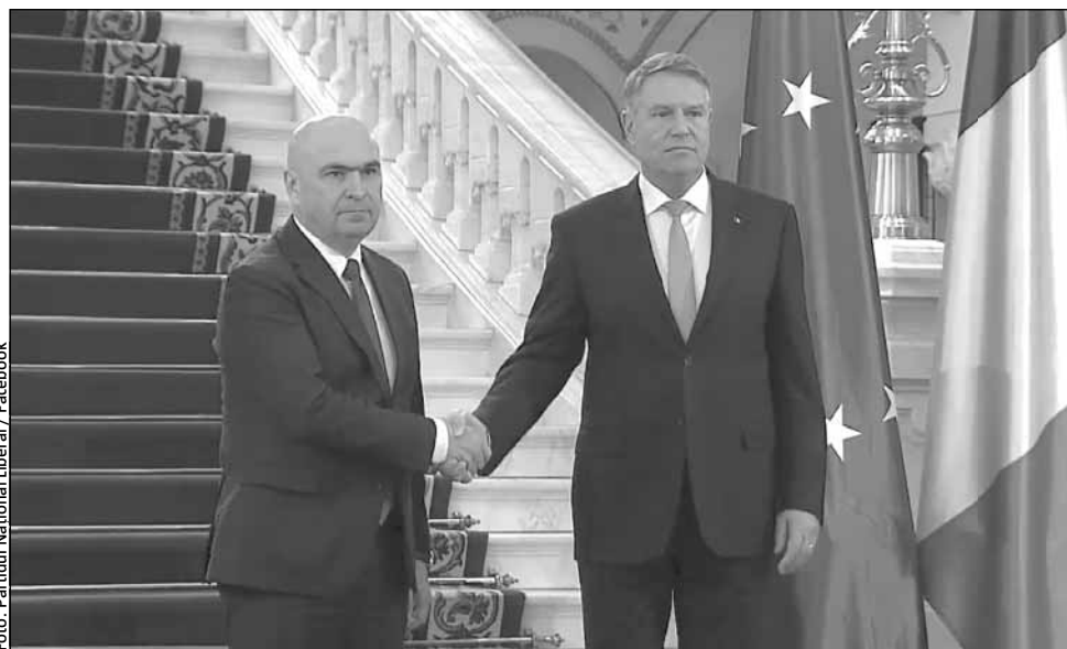
Ilie Bolojan și Klaus Iohannis

„Suntem deja în procedura pentru alegerea noului președinte al României, dacă va fi ceva de spus, evident, poate să spună, dar cred că domnul Bolojan este despre viitor și nu despre trecut. Despre viitorul României și nu despre ceea ce reprezintă deja partea istoriei, partea trecutului, ci că prioritățile majore ale României astăzi sunt cele legate de faptul că avem de menținut parcursul euroatlantic al acestei țări, avem de adus fondurile europene, adevărata mină de aur pentru România în țară, avem de făcut reforma statului pentru a recâștiga încrederea românilor în clasa politică, cu măsuri ferme, corecte, cu măsuri care să fie percepute și la propriu, în detaliu, nu doar în imagini, ca fiind în interesul public general, avem nevoie de recâștigarea încrederii românilor în instituțiile democrației din România. Nu, dimpotrivă, considerăm că este un moment foarte bun, pentru ca lucrurile pro-