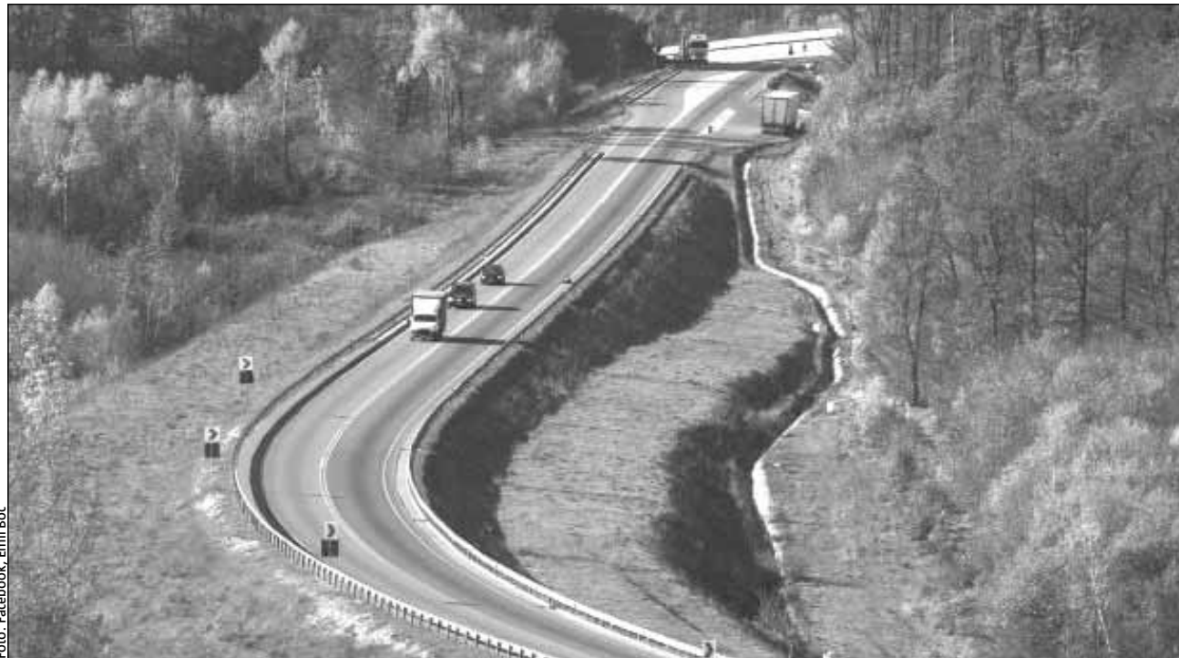
Centura metropolitană Cluj presupune costuri mai mari pentru realizare

„Această necesitate de actualizare este generată de modificările economice semnificative, survenite între 2022 și 2025, care au dus la creșterea considerabile ale costurilor materialelor de construc-