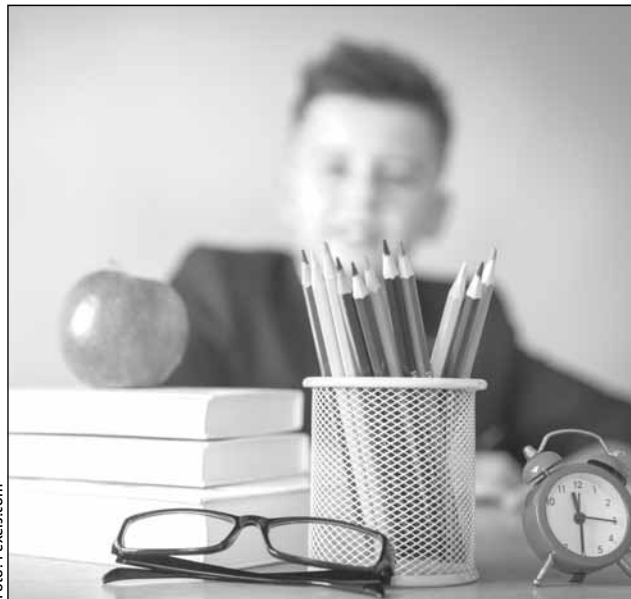
Structura anului școlar 2025-2026

■ de luni, 3 noiembrie 2025 până vineri, 19 decembrie 2025;