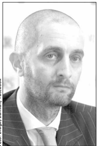
Schimbări în echipa premierului