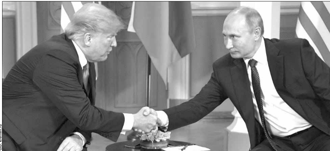
Dacă un acord între Donald Trump și Vladimir Putin va duce la divizarea Ucrainei, România ar fi nevoită să împartă o graniță directă cu Rusia

Situația din Ucraina „corespunde în mare măsură cu-