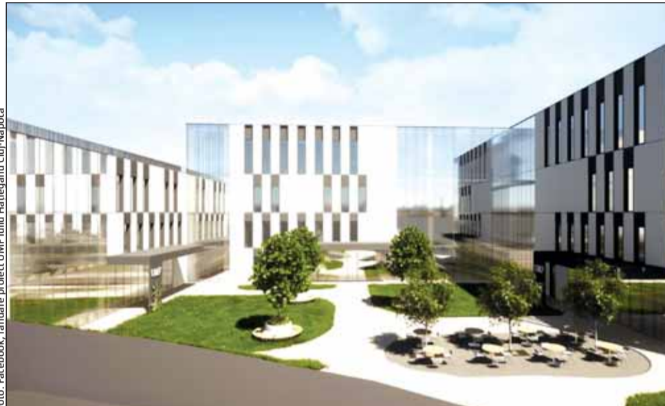
Centrul de simulare, chirurgie experimentală și training, realizat de UMF Cluj

Potrivit proiectului de hotărâre de Guvern, noul centru (cu un regim de înălțime 3S+P+2E+Er) va acoperi o serie de funcțiuni necesare pregătirii, specializării și cercetării în diferite domenii pentru sănă-