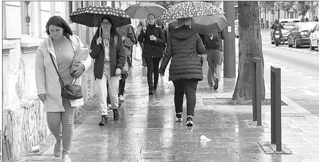
Sursele frustrării: o Românie care nu e condusă de români sau pentru români

Unul dintre cele mai evidente motive de nemulțumire identificate de cercetare este legat de clasa politică din