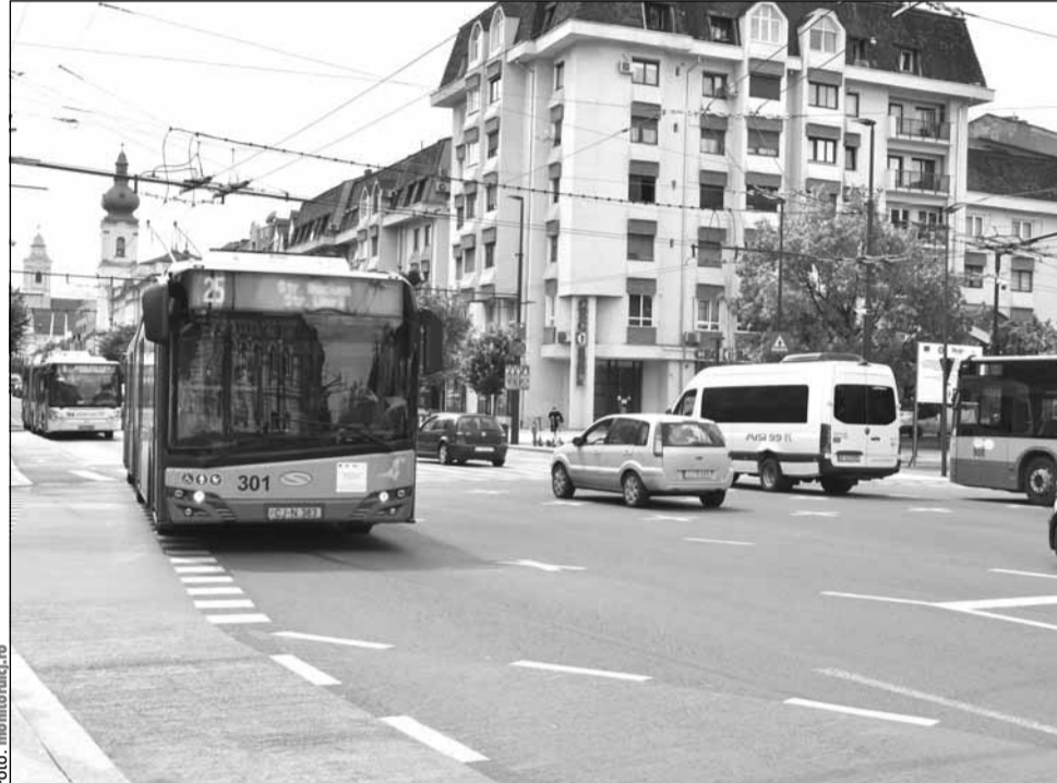
Stație suplimentară de tren la Aeroport și transport public prioritizat Florești – IRA

Proiectul trenului metropolitan Cluj include patru pasa-