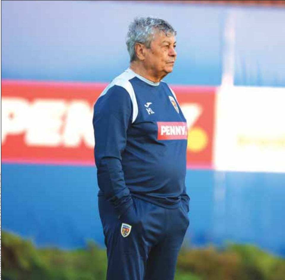
Mircea Lucescu pierde încă un titular

Mihăilă s-a accidentat în prima repriză a partidei Parma – Lecce, 1-3, din 31 ianuarie. A fost titular, a avut și o ocazie uriașă de a marca, atunci când mingea a lovit bara în minutul 21, dar chiar înainte de pauză s-a