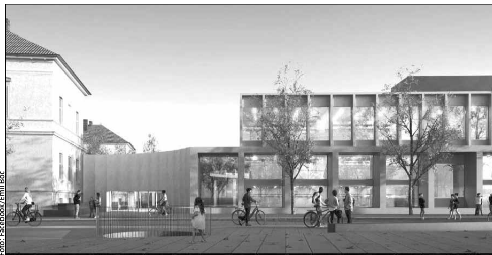
Modernizarea Liceului „Nicolae Bălcescu” și a străzilor adiacente ar putea fi realizate din fonduri europene

Astfel, proiectul de reabilitare și modernizare a zonei Liceului Nicolae Bălcescu