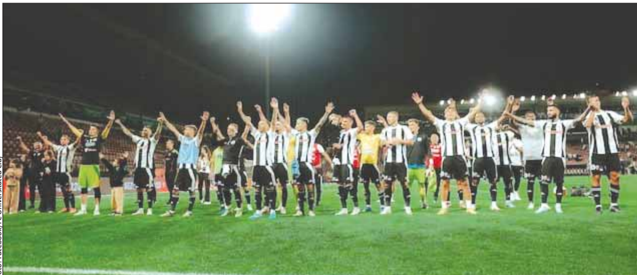
Universitatea Cluj a obținut o victorie dramatică cu scorul de 3-2 în fața Unirii Slobozia

„U” Cluj revine pe podiumul SuperLigii, la egalitate cu Universitatea Craiova, asigurându-și totodată prezența în play-off. Pe de cealaltă parte, Slobozia bifează al cincilea eșec consecutiv.