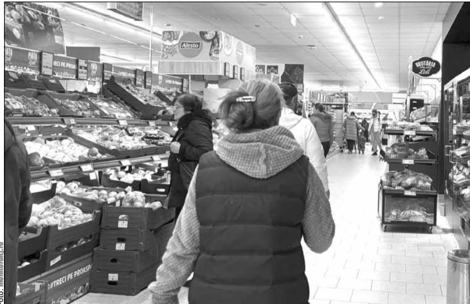
Rata anuală a inflației ar urma să ajungă la 3,8% în trimestrul IV din 2025, conform așteptărilor BNR

„În Europa un eventual război comercial nu va avea numai un impact inflaționist, ci cred că va crea recesiune. Și atunci lucrurile chiar se complică și pentru România. Pentru că noi, deja intrăm într-o perioadă de deficit de cerere. Anul trecut noi am avut o creștere masivă a consumului, dar această creștere a consumului nu s-a dus în creștere economică, ci s-a