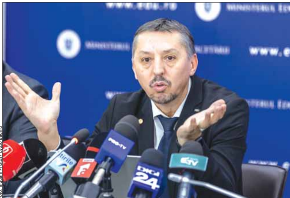
În viziunea ministrului Educației, Daniel David, un absolvent de liceu trebuie să dețină opt competențe cheie

„Trunchiul de bază acoperă aceste elemente din cultura generală, pentru că, nu uitați, trunchiul comun în acest moment se referă de la specializarea matematică-informatică, până la coregrafie și atunci gândiți, în această diversitate de specializări, care sunt elemen-