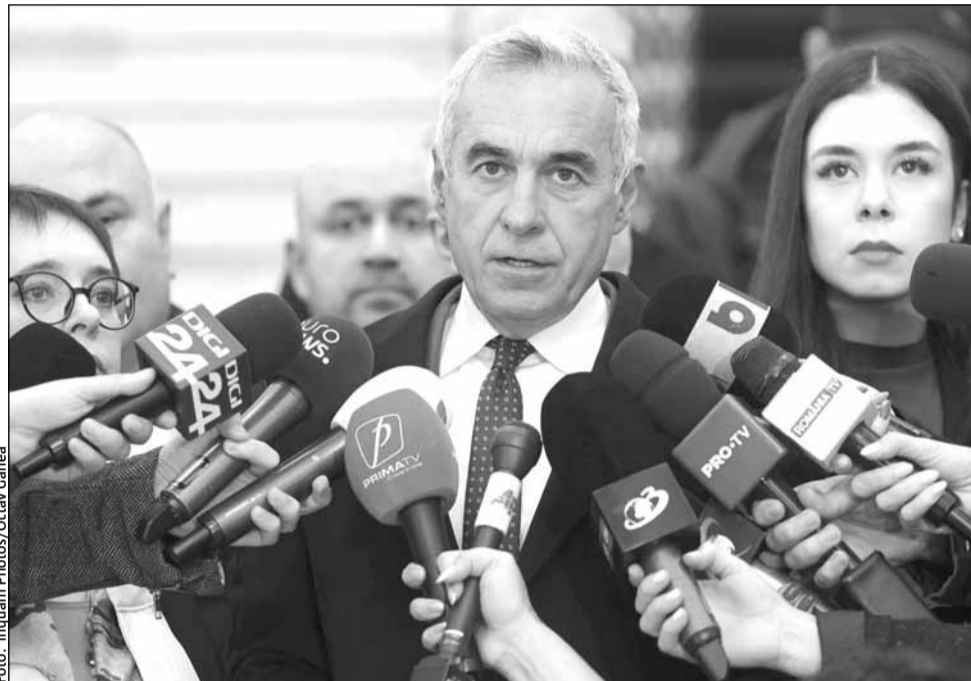
Amenințări halucinante din partea pro-rusului Călin Georgescu

Georgescu nu a explicat ce înseamnă „rețeaua Soros” și nici cine ar face parte din această „rețea”. De altfel, Georgescu a anunțat că