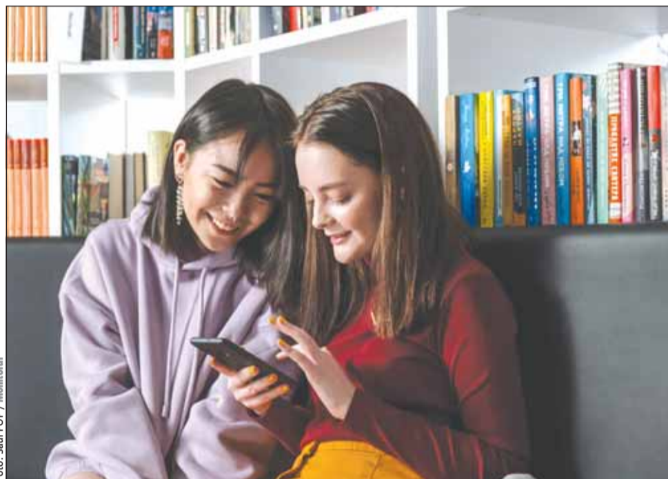
Tinerii români susțin că nu au fost expuși la dezinformare recent

Proportia tinerilor din România care susțin că sunt favorabili UE și modului în care