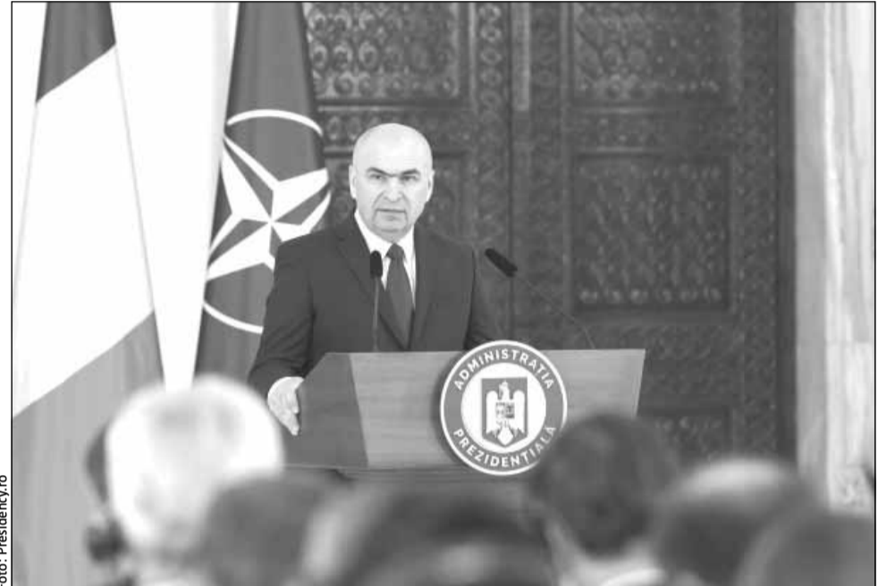
Președintele interimar Ilie Bolojan

Ilie Bolojan a arătat că al doilea mesaj este că România este un stat democratic, care lucrează în continuare pentru a consolida instituțiile și încrederea în acestea.