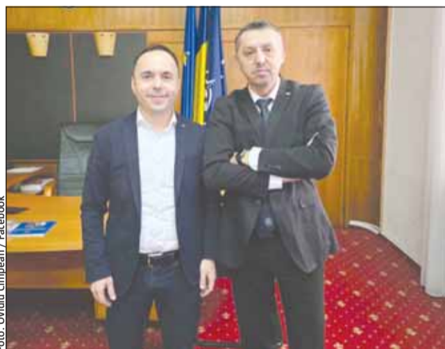
Ovidiu Cîmpean deputat și Daniel David, ministrul Educației

„Am subliniat importanța unei reforme educaționale bazate pe flexibilitate, conectare la piața muncii și un curriculum echilibrat. De asemenea, am evidențiat necesitatea unei consultări reale cu toți actorii implicați pentru a construi un sistem de învățământ adaptat provocărilor viitorului. Îl felicit pe ministrul Educației, Daniel David, pentru organizarea unui proces de consultare reală pentru o reformă care chiar contează”, spune deputatul Ovidiu Cîmpean în mesajul publicat pe pagina sa de Facebook.