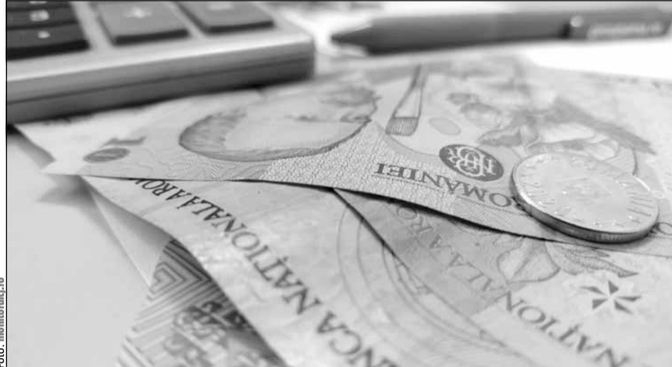
Două riscuri majore pentru buget: instabilitate politică și presiuni economice externe

„În bugetul pentru acest an, au fost luate în calcul cifre de referință realiste care pot fi puse însă în pericol de evenimente neprevăzute în economia globală și locală. Mai exact, bugetul se bazează pe o creștere economică de 2,5% – mai mare decât cea de anul trecut – și o inflație anuală de 4,4%, mai moderată față de anul precedent. Astfel, guvernul a proiectat o creștere a veniturilor