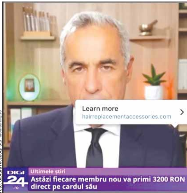
Noi mesaje manipulatorii pe rețelele de socializare care îl aduc în prim-plan pe Călin Georgescu sunt promovate pe Facebook

Nu este prima dată când Facebook este invadat de pagini și reclame ce promovează nostalgii comuniste sau reclame manipulatorii de promovare intensă a imaginii „independentului” Călin Georgescu, cu o finanțare a campaniei electorale pe TikTok estimată la 1 milion de euro, potrivit documentelor declasificate în decembrie anul trecut de CSAT și care face obiectul unei anchete deschise de procurori pentru finanțare ilicită, spălare de bani și atacuri cibernetice.