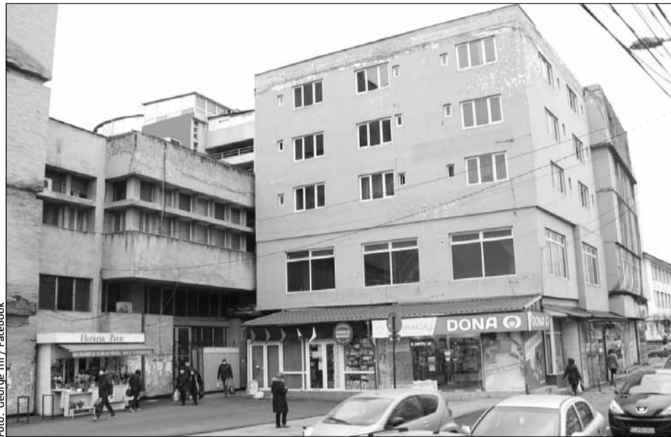
Situația hotelului Cristian din zona Pieței Mihai Viteazul se află într-un blocaj juridic

În condițiile în care imobilul nu poate fi demolat, iar proprietarul nu poate dezvolta legal proiectul, primarul Emil Boc a propus o discuție față-n față cu acesta pentru deblocarea situației.