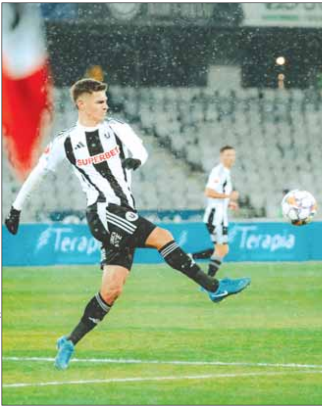
Sezon istoric pentru „U” Cluj și cea mai bună performanță din ultimii 53 de ani

Cea mai recentă clasare a „studenților” între primele șase echipe s-a consemnat la finalul sezonului 1971-1972, când aceștia au terminat stagiunea pe locul al treilea, obținând calificarea în Cupa UEFA. Performanța a reprezentat a doua cea mai bună clasare din istoria clubului, după locul al doilea obținut în perioada interbelică (1932-1933).