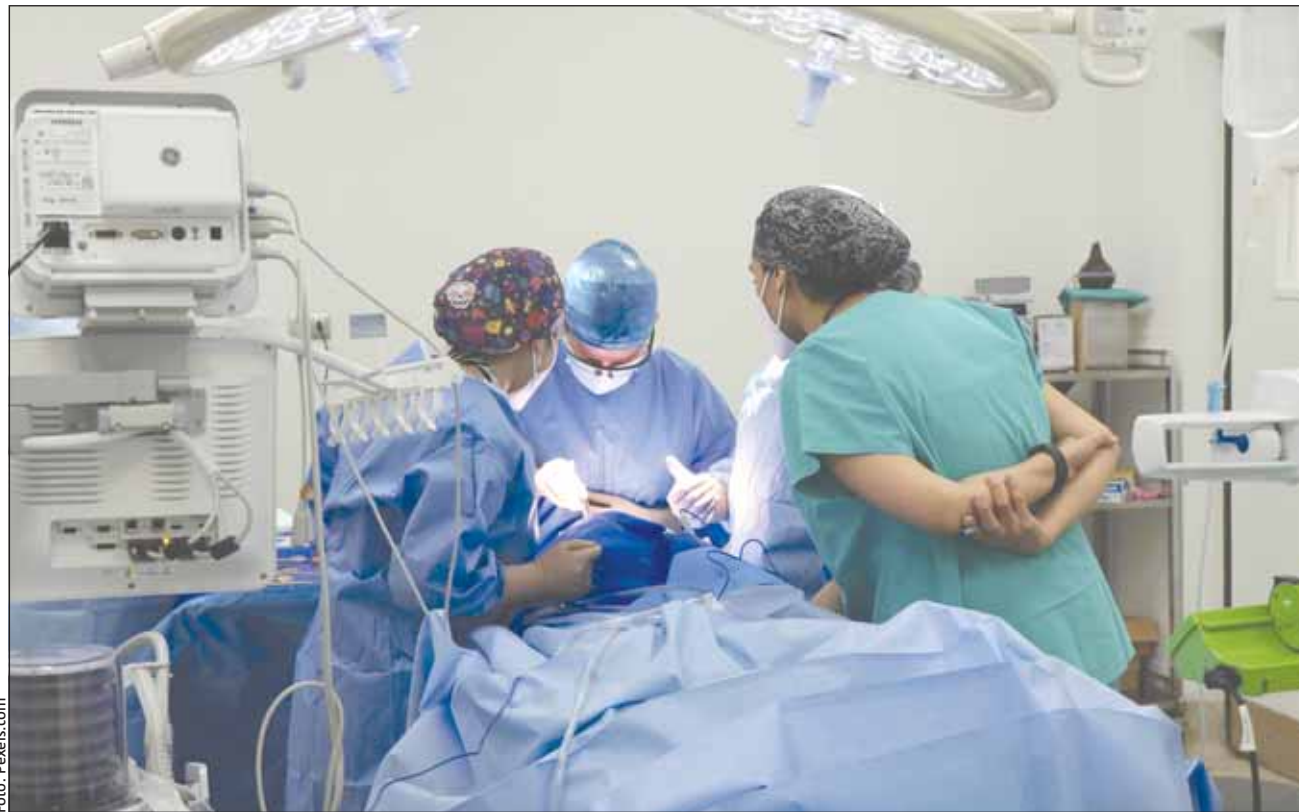
La vârsta la care alții stau cu nepoții în parc sau își trăiesc bătrânețea în liniște, unii medici se încapățânează să intre în sălile de operații și nu realizează că după decenii petrecute în spital nu mai pot practica medicina cum o făceau în tinerețe