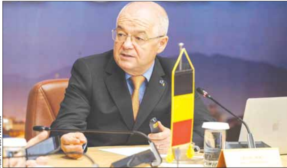
Emil Boc : „Dacă Europa eșuează, democrația va eșua”

„Dacă Europa eșuează, democrația va eșua. Dacă Europa eșuează, pacea va eșua”, a explicat Emil Boc.