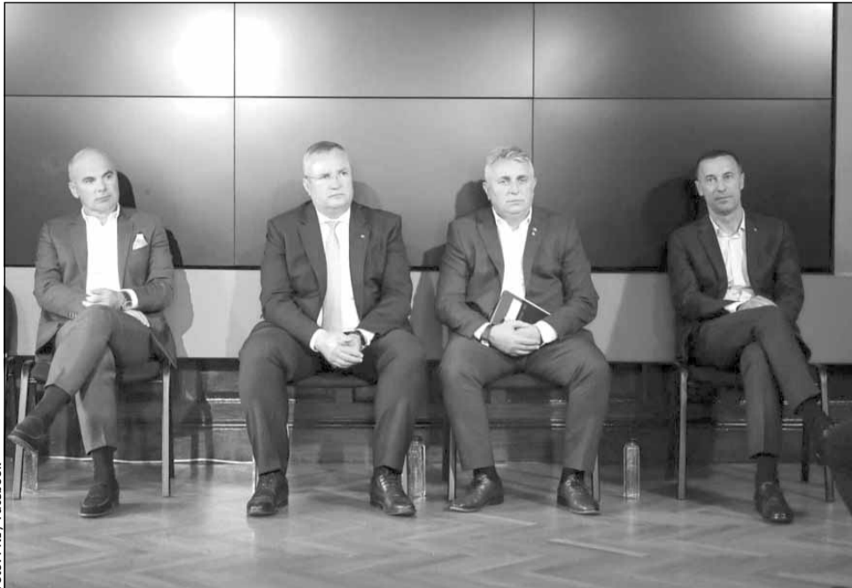
Foștii lideri ai PNL sunt acuzați ca „au amanetat” partidul. În imagine, Rareș Bogdan, Nicolae Ciucă și Lucian Bode

În urma evaluării făcute de noua conducere a PNL, concluzia a fost că partidul nu își poate permite plata ratelor negociate de Bode. Astfel, potrivit înțelegerii agreeate de fostul secretar general al partidului, libe-