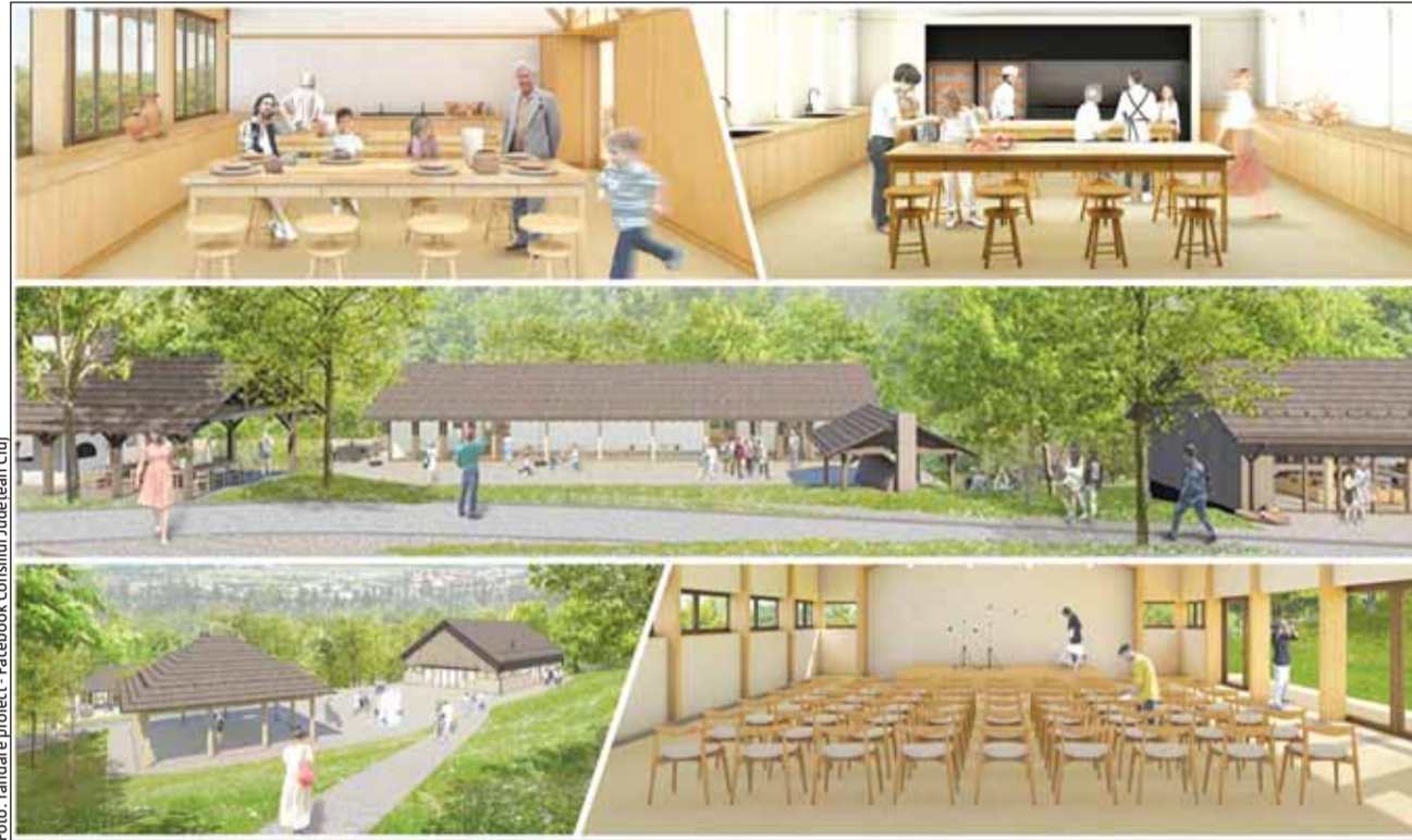
Primul muzeu în aer liber din România, revitalizat de Consiliul Județean Cluj cu bani europeni

„Urmărim punerea în valoare a unuia dintre cele mai importante obiective din județ, cu un potențial turistic imens, care atrage anual zeci de mii de vizitatori și în cadrul cărui sunt organizate o serie de evenimente culturale extrem de cunoscute. Oda-