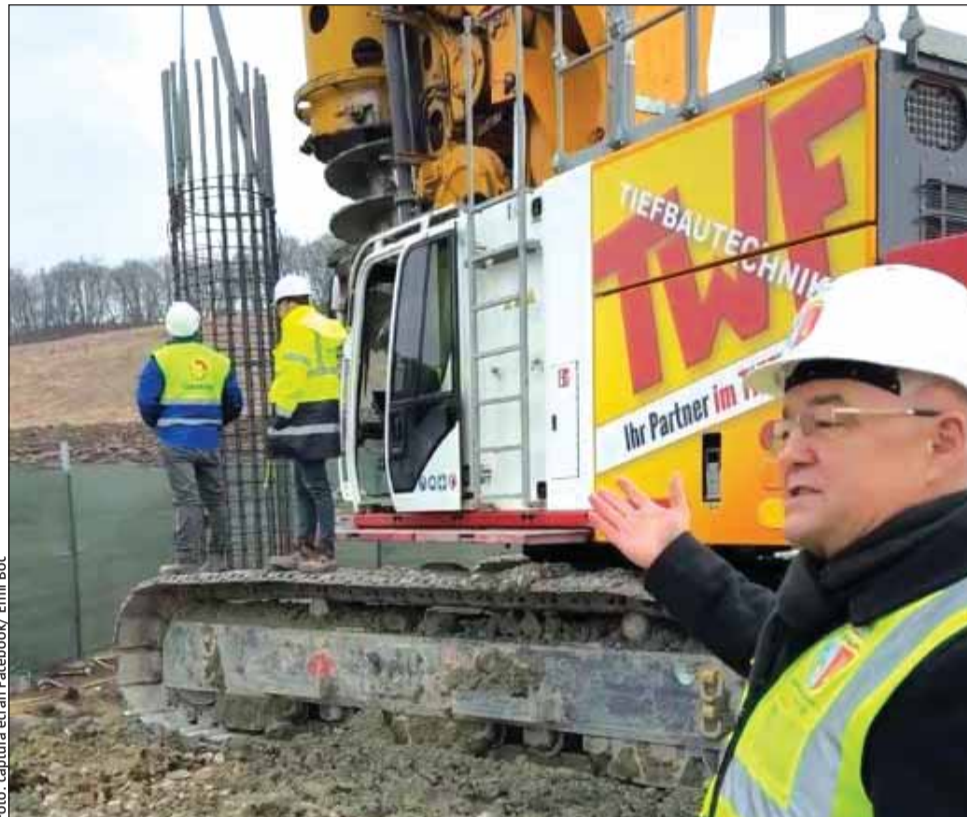
Lucrările la metroul din Cluj continuă în teren cu amplasarea a peste 90 de piloți forati din zona stației Teilor, în Florești

Astfel, pentru stabilizarea versantului, experții au decis amplasarea a 96 de piloți forati. După introducerea piloți-