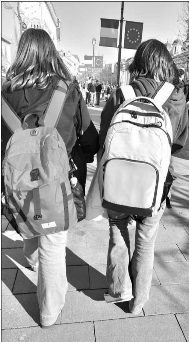
Universitatea Babeș-Bolyai susține restructurarea curriculumului liceal

Conform aceleiași surse, scopul final este optimizarea propunerilor inițiale, ca rezultat al dialogului cu profesorii și alți experți și decidenți, precum și cu beneficiarii direcți – elevii, și indirecți – părinții, membri ai societății civile și ai pieței muncii etc.