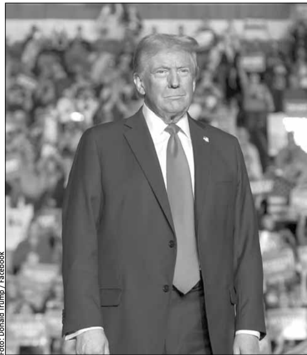
Taxele lui Donald Trump se vor regăsi în scumpiri

• Membrii CA al BNR au mai discutat despre „cotele ridicate și în creștere” ale așteptărilor inflaționiste pe termen scurt ale firmelor și consumatorilor. • Din partea investițiilor este însă posibil un aport ne-