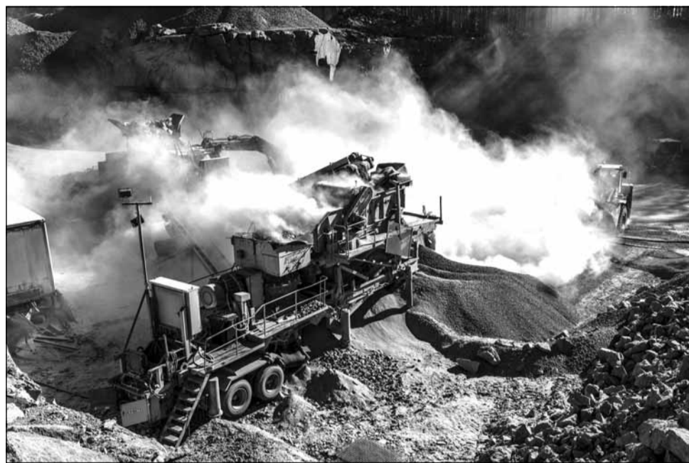
Resursele minerale ucrainene, inclusiv pământurile rare, râvnite de Trump sunt majoritatea dificil de exploatat

Președintele republican Trump a insistat că dorește compensații pentru ajutorul militar și economic oferit Ucrainei de administrația predecesorului său democrat Joe Biden în războiul cu Rusia, el estimând suma datorată de Kiev la 500 de miliarde de dolari, de aproximativ patru ori mai mult decât ajutorul de circa 120 de miliarde de dolari estimat de Institutul Kiel pentru Economie Mondială (IfW Kiel).