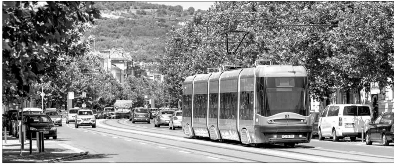
Municipalitatea alocă peste 20 de milioane de euro în 2025 pentru modernizarea a 23 de străzi din municipiu

Proiectul pasajul subteran din zona B-dul Muncii-Oașului presupune reconfigurarea zonei prin realizarea unor noi șine pentru circulația tramvaielor, refacerea structurii rutiere cu o soluție semirigidă și realizarea unui pasaj subteran