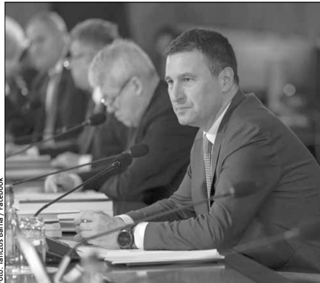
Barna Tanczos, ministrul Finanțelor

„Ministerul Finanțelor, într-adevăr, a propus un buget în cursul lunii ianuarie. Bugetul a fost aprobat la începutul lunii februarie și acum suntem etapa de implementare a acestui buget. Un buget care vine după o perioadă destul de agitată în România, cu alegeri multiple în 2024. De asemenea, putem spune că a fost un deficit care rar se mai întâlnește într-o țară din Uniunea Europeană și de acolo trebuie să-și revină practic acest sistem fiscal-bugetar și să intrăm pe un trend de reducere a deficitului. Și nu doar din cauza faptului că avem o înțelegere cu Comisia Europeană pe acest sistem de reducere a deficitului de la 7% la 3%, până în 2031, dar avem și cele elemente de macrostabilitate, prudențialitate, de perspectivă pozitivă, de sustenabilitate. Altfel, este practic greu de imaginat că acest echi-