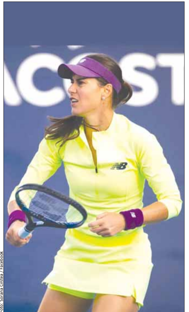
Sorana Cîrstea este printre cele trei reprezentante pe tabloul feminin de la Indian Wells

Pe locul doi este poloneza Iga Swiatek, cu 7985 puncte, iar pe trei este Coco Gauff, cu 6333 puncte.