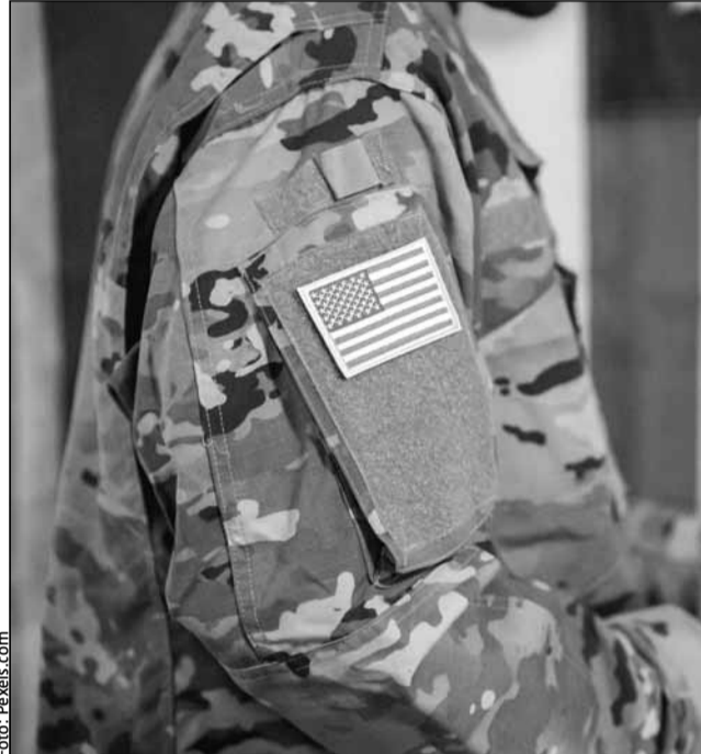
Fără sprijinul SUA, lupta Ucrainei pentru supraviețuire va fi și mai dură

Congresul a aprobat, în cele din urmă, pachetul de ajutor în valoare de 60 de miliarde de lire sterline în primăvara lui 2024. A fost la limită, deoarece Ucraina se lupta să