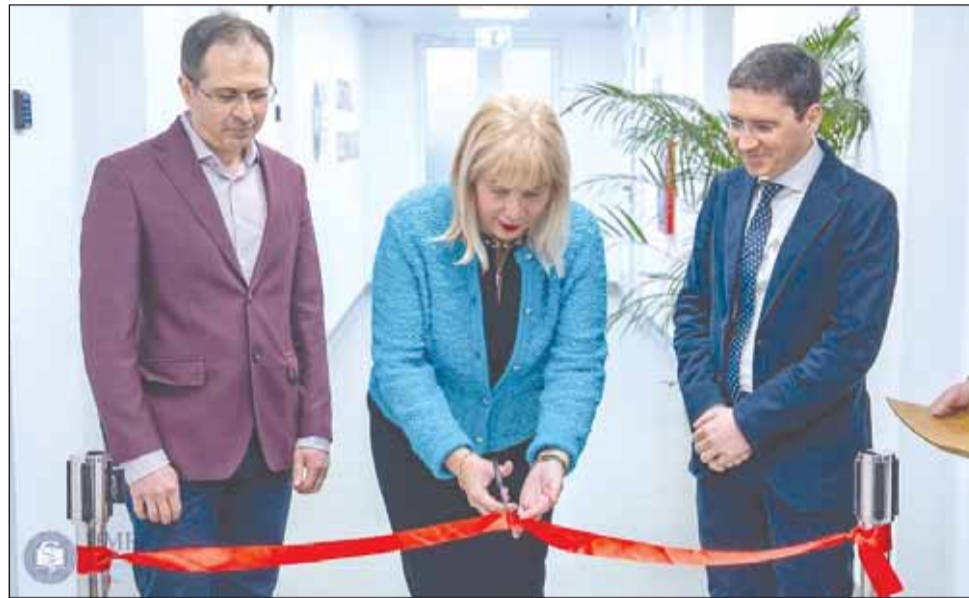
UMF „Iuliu Hațieganu” Cluj-Napoca extinde Centrul de Simulare Medicală pentru rezidenți

1 Laboratorul de chirurgie robotică este dotat cu două simulatoare DaVinci și le permite rezidenților în urologie și chirurgie generală să exerseze tehnici complexe, precum prostatectomia radicală, lobectomia (intervenții pe plămâni), histerectomia (îndepărtarea uterului) și hernioplastia (corectarea herniei inghinale) efectuate robotic, cu o abordare minim invazivă. Aceste simulatoare reproduc cu precizie intervențiile realizate cu robotul chirurgical