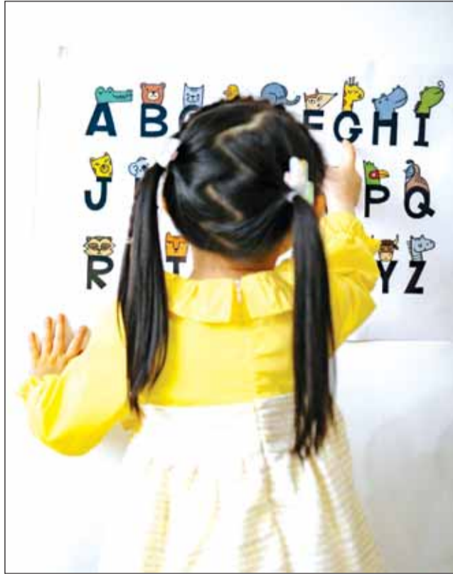
Pentru ciclul primar, în anul școlar viitor, vor fi înființate peste 100 de clase

„În foarte multe situații, școlile de cartier, din proximi-