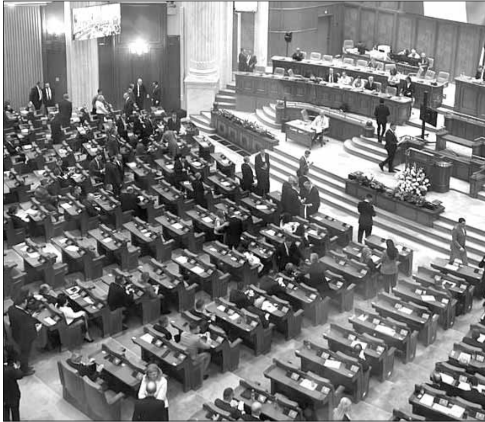
USR ia în considerare depunerea unei moțiuni de cenzură împotriva Guvernului Ciolacu

„USR nu face un astfel de parteneriat cu Marcel Ciolacu premier. USR va depune o moțiune de cenzură în luna mai. De ce în luna mai? Pentru că, după cum vedeți, acum în Parlament balanța este destul de echilibrată și nu prea mai ai de ce trage. Parlamentarii sunt împărțiți, așa cum am văzut, cu majoritate pentru susținerea Guvernului”, anunța, miercuri,