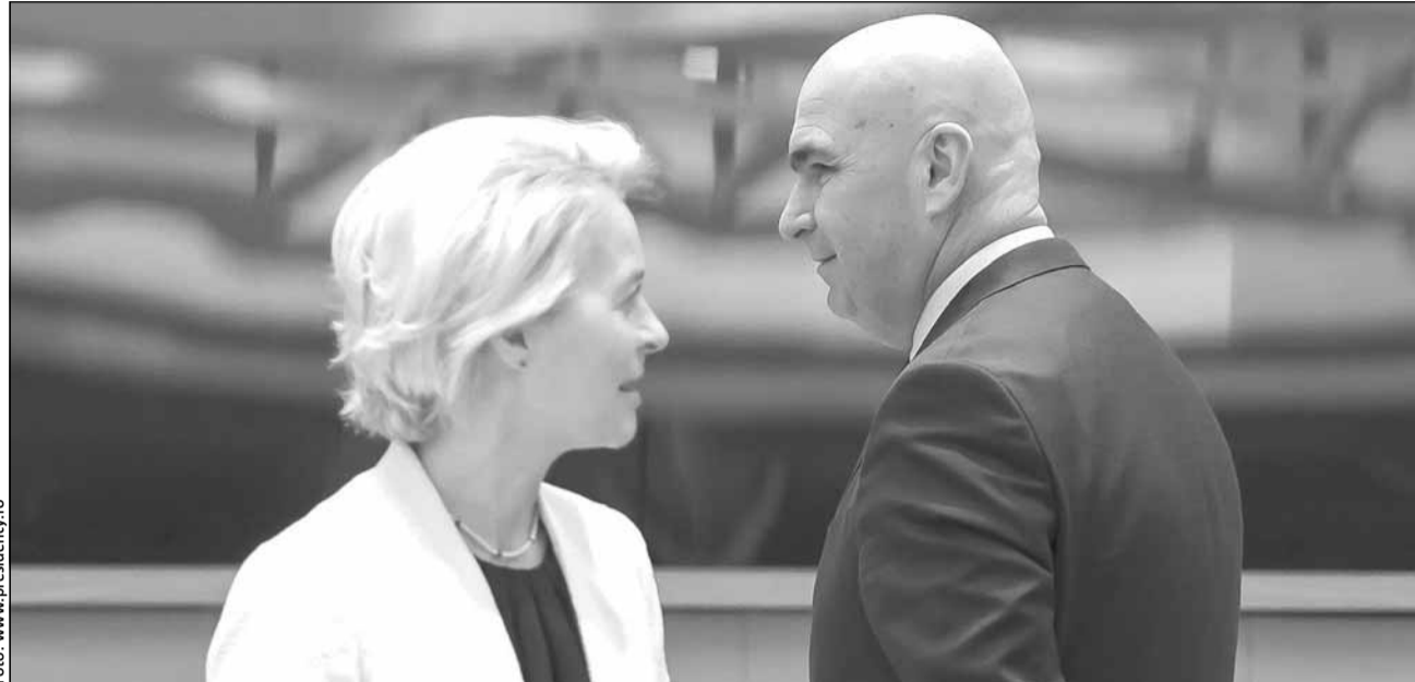
Președintele interimar Ilie Bolojan a discutat cu președinta Comisiei Europene (CE), Ursula von der Leyen

Într-o postare pe rețelele sociale, Viktor Orbán a spus: „Întâlnirile mele din Franța au confirmat că, deși s-ar putea să nu fim de acord cu privire la modalitățile de pace, suntem de acord că trebuie să întărim capacitățile de apărare ale națiunilor europene, iar aceste eforturi ar trebui să împuternicească statele membre, mai degrabă decât birocrații de la Bruxelles”. El a salutat cooperarea „excepțional de strânsă” cu Franța și a spus că se așteaptă ca companiile fran-