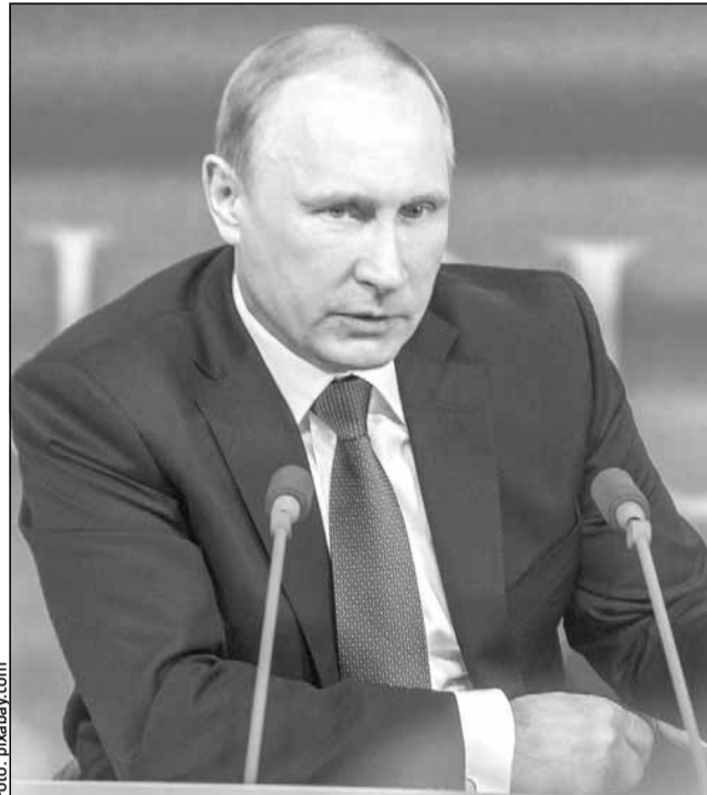
Umbra influenței Kremlinului planează masiv în Europa de Est

Expertii spun că aceste incidente fac parte din strategia mai largă a Kremlinului de a semăna neîncredere și de a influența alegerile în ceea ce consideră a fi sfera sa de influență, în timp ce aceste țări încearcă să aprofundeze cooperarea cu Occidentul. Modelele de interferență electorală observate în Georgia, România și Moldova evidențiază o realitate îngrijorătoare pentru Europa: strategiile de război hibrid ale Moscovei devin din ce în ce mai sofisticate și mai răspândite.