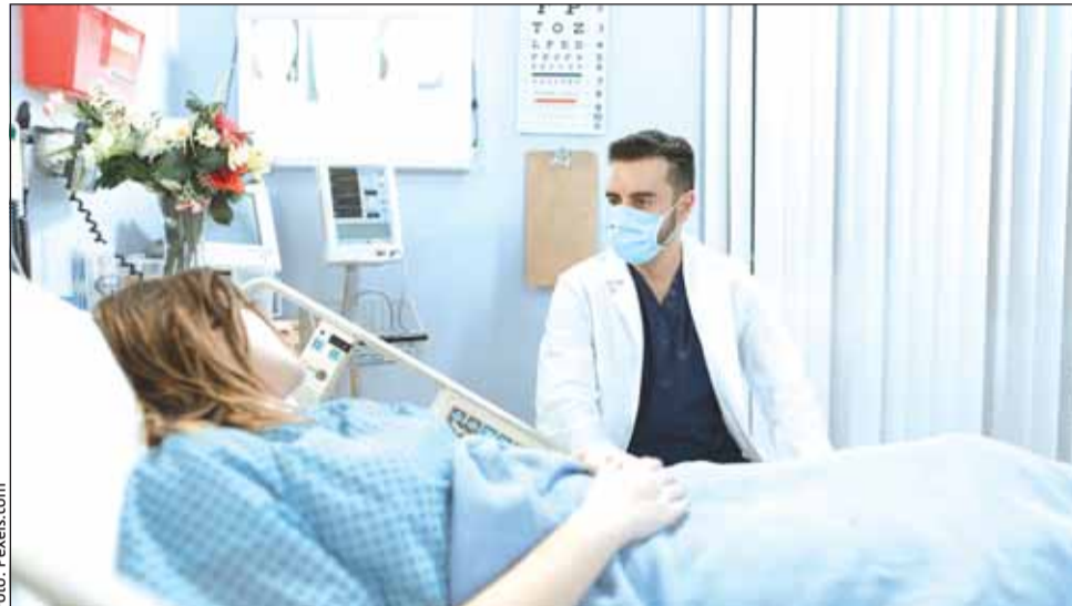
Cancerul gastric rămâne una dintre cele mai grave afecțiuni oncologice

Există o variație largă a incidenței cancerului gastric în Europa. Țările cu cea mai mare incidență sunt țările baltice, Portugalia și Slovenia. În plus, riscul de cancer variază între diferitele populații din