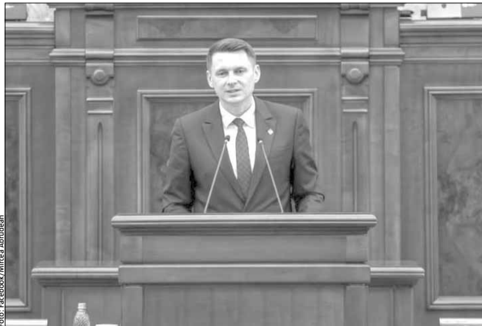
Luni, Senatul a ratificat acordul de sediu pentru agenția europeană ECCC

Procesul de negociere privind acordul de sediu s-a derulat în runde succesive, în baza mandatului aprobat de Guvernul României în decembrie 2022. „Senatul a ratificat Acordul de sediu al ECCC, prima agenție europeană cu sediul la noi în țară. 9 mai 2023, participam, în calitate de șef al Cancelariei prim-ministrului la evenimentul de anunțare a deschiderii primelor birouri ale Centrului european de competențe în materie de securitate