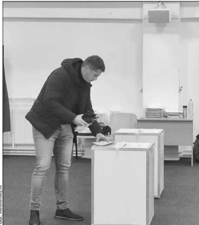
Bărbat care votează la alegerile parlamentare din 2024

Președintele AUR a salutat decizia CCR drept „un pas înainte spre revenirea la democrație”. „Azi s-a făcut un pas înainte spre revenirea la democrație. Voi reveni la voința poporului român! Nu