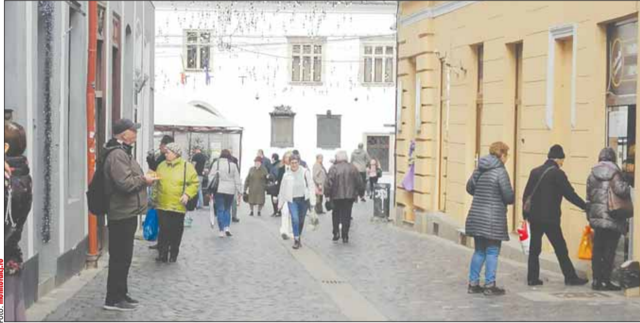
Piața Muzeului din Cluj-Napoca

Ratingul Baa3 atribuit României reflectă „dimensiunea moderată și potențialul de creștere al economiei”, dar ține cont de profilul de credit, țara fiind expusă la riscul ge-