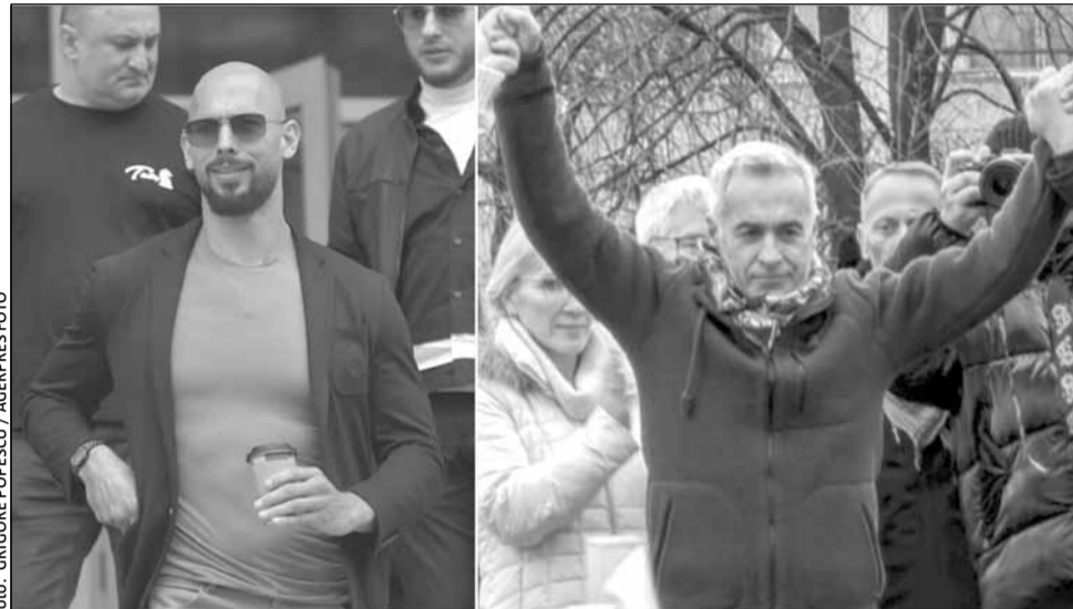
Andrew Tate, la ieșirea din clădirea Tribunalului București 2024-05-08

Cei doi bărbați au puțin în comun, dar afirmațiile lor cum că au fost amândoi supuși unei „vânători de vrăji-