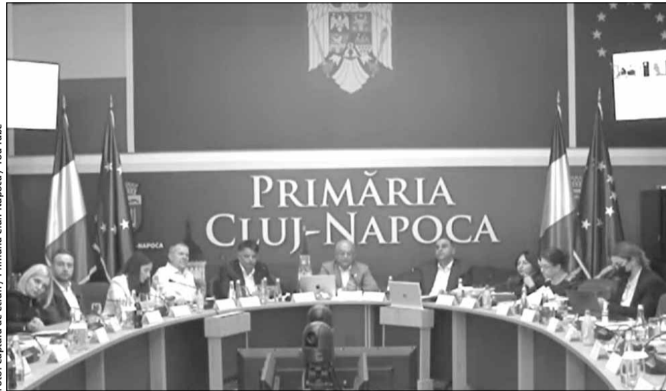
Ședința ordinara a Consiliului local al municipiului Cluj-Napoca din 27 martie 2025

Potrivit lui Emil Boc, faptul că 55% din banii bugetului local vin din alte surse surse decât cele bugetare locale arată faptul că municipalitatea clujeană își face treaba pentru menținerea direcției de dezvoltare a orașului.