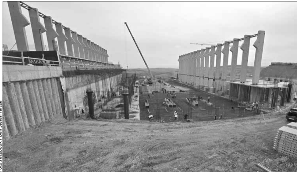
Lucrările la bazinul olimpic din Borhanci continuă într-un ritm alert

„Lucrările avansează constant la unul dintre cele mai importante proiecte sportive ale Clujului! Toate elementele de beton ale structurii au fost deja finalizate. Se lucrează la armătura pentru turnarea radierului în zona bazinului de sărituri. Ne pregătim pentru turnarea pereților laterali ai bazinului de sărituri. La etaj, zona este pregătită