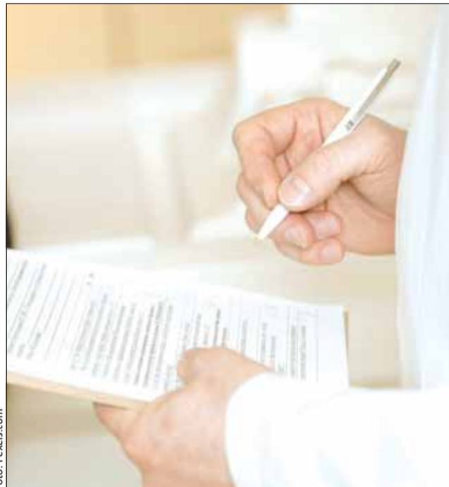
număr redus de consultații preventive, birocrație excesivă

Conform raportului cu privire la eficientizarea resurse-