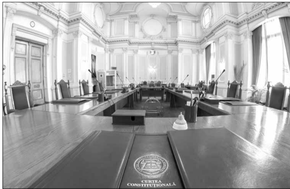
Una dintre mizele numirilor la CCR e echilibrul între magistrați și non-magistrați în interiorul curții

Alte figuri apropiate de PSD care și-ar dori nominalizarea la CCR sunt Mihai Busuioc, actualul președinte al Curții de Conturi, și Florin Iordache. Iordache e președintele Consiliului Legislativ și a devenit cu-