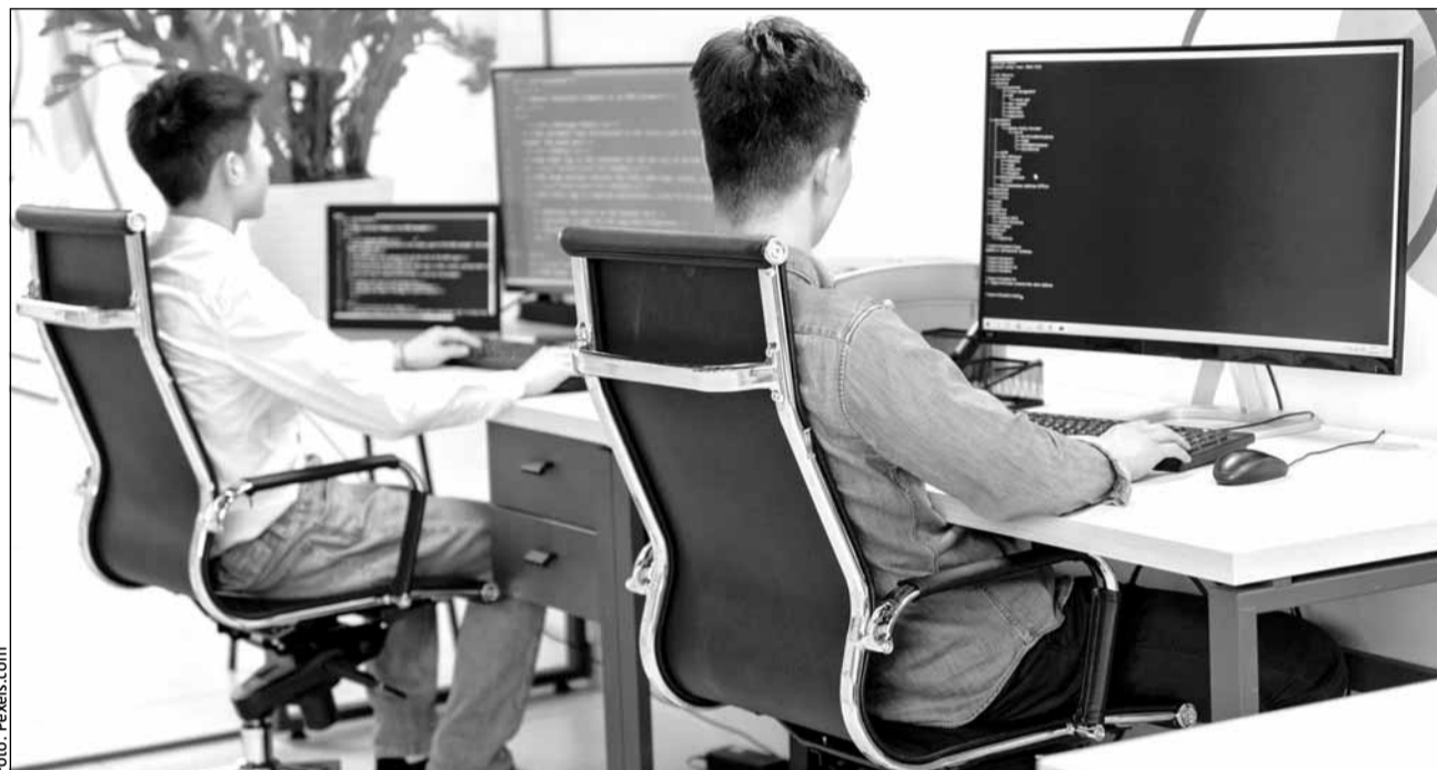
Creșterea prețurilor și posibilele măsuri punitive din partea SUA ar putea afecta economia românească

„În contextul actual al relațiilor comerciale internaționale, măsurile și contra-măsurile adoptate de Statele Unite au devenit subiecte de intensă dezbateră și negociere, atât în raport cu economiile mari, precum UE și China, dar și cu vecinii săi direcți, Canada și Mexic. Aceste acțiuni par să fie parte dintr-un joc complex de obținere a unor concesi, dar și a unor avantaje pe termen lung, în care SUA își vede consolidată poziția pe piața globală. A curs multă cerneală pe acest subiect în ultimele două luni, așa că mi-am propus să ne uităm mai concret ce anume aduce acest context dificil economiei României. Și impactul e mai complex decât se observă la prima vedere”, scrie Alex Milcev.