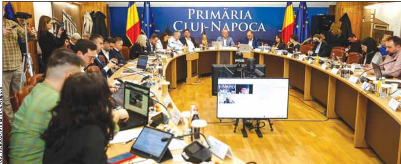
Primăria a publicat lista actualizată a veniturilor salariale din administrația locală

Conform art.16, alin. (2) din Legea-cadru nr. 153/2017, actualizată: „Indemnizațiile lunare ale președinților și vicepreședinților consiliilor județene și primarilor și viceprimarilor unităților administrativ-teritoriale care implementează proiecte finanțate din fonduri europene nerambursabile și/sau fonduri externe rambursabile, precum și prin Mecanismul de