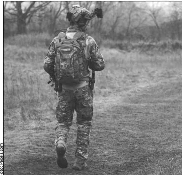
Mai mulți militari și-au luat concediu de creștere a copilului, dar au plecat să lupte ca mercenari în Congo

Însă MApN a efectuat și alte verificări și a descoperit că șapte militari în activitate, doi