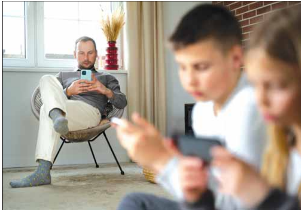
O scenă contemporană în care tehnologia a ridicat o barieră invizibilă între membrii aceleiași familii. Părințele și adolescenții absorbiți de ecrane în detrimentul interacțiunii reale.

„Acest fenomen face parte din accesul facil la tehnologie al tinerilor și poate avea repercusiuni în zona în care noi lucrăm ca psihiatri sau ca profesioniști din domeniul sănătății mintale. Vorbim în primul rând despre adicțiile de internet, de smartphone, gaming sau de social media. Deși tehnologia vine la pachet cu multe aspecte