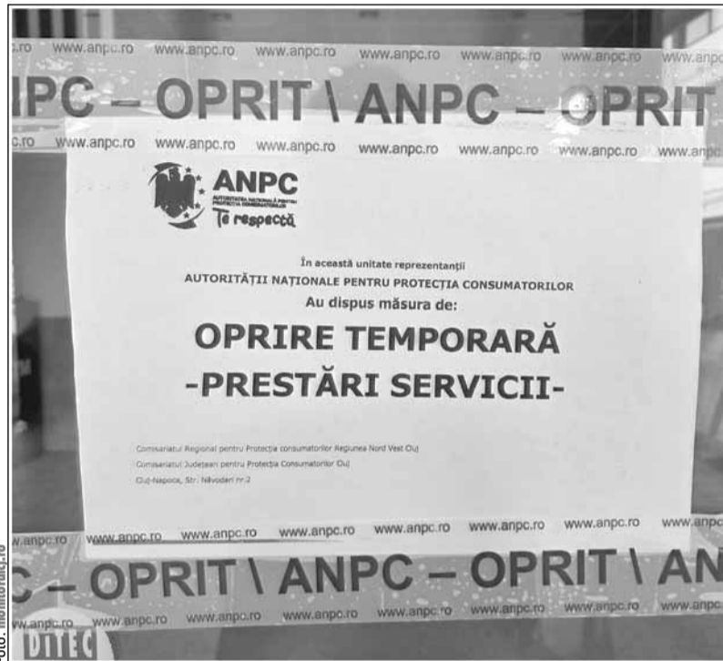
Piața Agroalimentară Mihai Viteazu, închisă de Protecția Consumatorilor

Joi, Comisariatul Județean pentru Protecția Consumatorilor (CJPC) Cluj a derulat o serie de acțiuni de control la 22 de operatori economici care își desfășoară activitatea în Piața Mihai Viteazu.