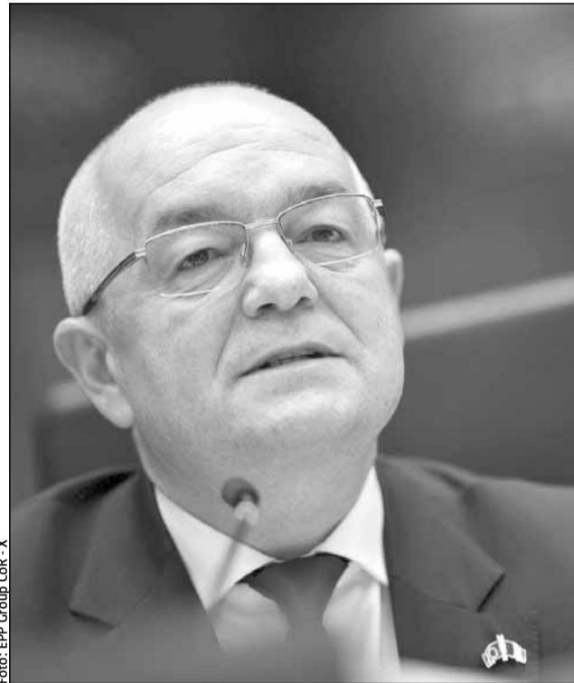
Emil Boc, primarul municipiului Cluj-Napoca

„Aceste priorități sunt reale și trebuie finanțate! Dar, politica de coeziune nu poate fi întotdeauna un depozit de bani pentru noi și noi priorități! Politica de coeziune este o politică de investiții previzibilă și pe termen lung a Europei noastre! Europa nu trebuie să aleagă între apărare și coeziune, între drone și profesori. Între rachete și spitale. Trebuie să le facem pe amândouă”, a declarat Emil Boc, președinte al Comitetului European al Regiunilor pe politica de coeziune teritorială și bugetul UE (COTER) în cadrul de-