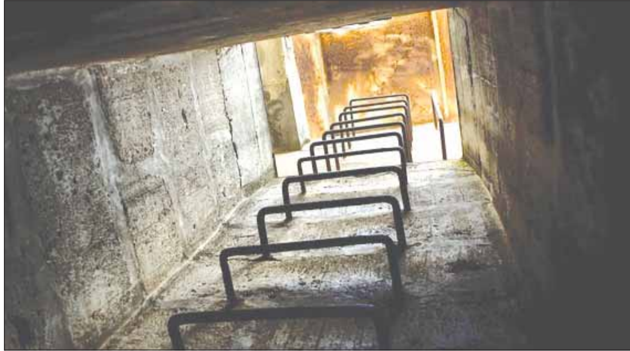
În județul Cluj, gradul de operaționalizare a adăposturilor civile este de 72%

Datele sunt aferente lunii decembrie 2023, iar Curtea de Conturi recomandă autorităților responsabile să elaboreze o Concepție națională a adăpostirii populației în situație de conflict armat, ca activitate pe timp de pace de pregătire a adăpostirii populației, întrucât actuala organizare a Sistemului național de adăpostire din România