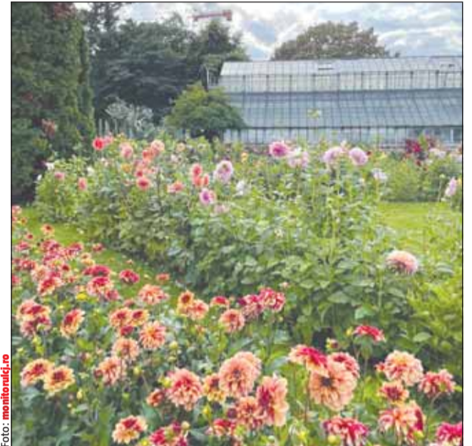
Grădina Botanică „Alexandru Borza”, Cluj-Napoca

„Turiștii români nu mai ocolesc de mult opțiunile de city break în țară. Fie că este vorba despre români plecați în afara țării care vor să descopere frumusețea țării noastre, fie de români care locuiesc în diferite colțuri ale țării, există o cerere în creștere pentru vacanțele urbane în țara noastră. Cluj-Napoca, Timișoara, București, Sibiu, Iași, dar și alte orașe din România sunt preferate de românii care caută city break-uri în țară”, se arată într-un comunicat al platformei de rezervări.