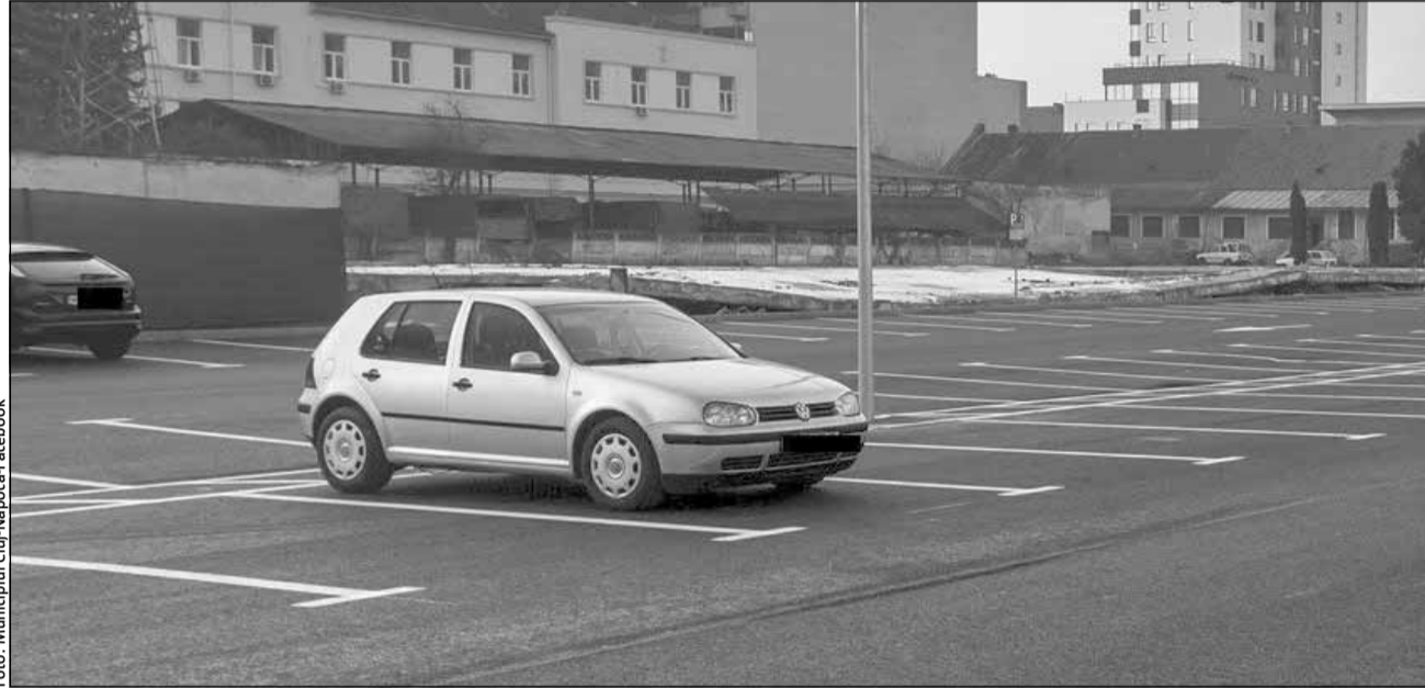
Ce se întâmplă cu taxa auto pentru mașinile poluante și cum se va calcula aceasta în viitor?

„Nu s-a stabilit formula de calcul și nici n-am avut discuții concrete cu reprezentanții autorităților locale, asociația comunelor, asociația orașelor sau municipiilor, pentru că trebuie să vină la pachet cu celelalte modificări ale sistemului fiscal. Cu siguranță, la momentul oportun, o să avem o dezbatere și pe această temă. Și aici, în principiu, propunerile trebuie să vină din partea acestor asociații, pentru că primăriile sunt cele care aplică implementarea, sau implementează aceste colectări de taxe locale și, în mod normal, primele propuneri trebuie să vină din partea lor”, a declarat Tanczos Barna joi,