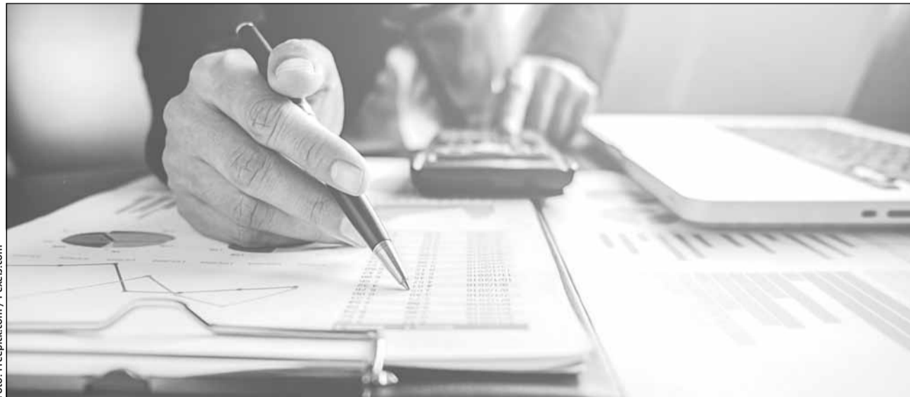
Trump a anunțat taxe vamale reciproce la nivel mondial. UE va avea taxe vamale de 20% pentru exporturile către SUA.

„Noi nu importăm de la ei decât undeva pe la 1,5 miliarde de euro și importăm sisteme de navigație, mașini electrice, echipamente electrice. În schimb, exportăm la ei produse din oțel, echipamente mașini electrice, cauciucuri și piese de schimb pentru auto, care nu sunt bunuri foarte avansate din punctul de vedere al prelucrării, deci direct n-o să fim afectați semnificativ de aceste taxe. Indirect putem fi afectați, prin prisma țărilor mai importante din UE care vând acolo, dar aici lucrurile trebuie tratate cu destul de multă atenție, pentru că există ceea ce numim noi în economie, în comerțul internațional, efecte de detournare de comerț. Adică, ca urmare a acestor taxe vamale mai mari, UE va răspunde și ea cu taxe mai mari pe tot ceea ce înseamnă produsele care vin din SUA. Atunci, da, germanul va vinde mai puține mașini în SUA, că există această taxă vamală, dar și americanul va vinde mai puține mașini în UE, pentru că va exista o taxă vamală similară. Atunci, vom vedea foarte mulți europeni care n-o să mai cumpere din SUA mașini, vor cumpăra din Germania mașini, deci în continuare comenzile vor merge într-o oarecare