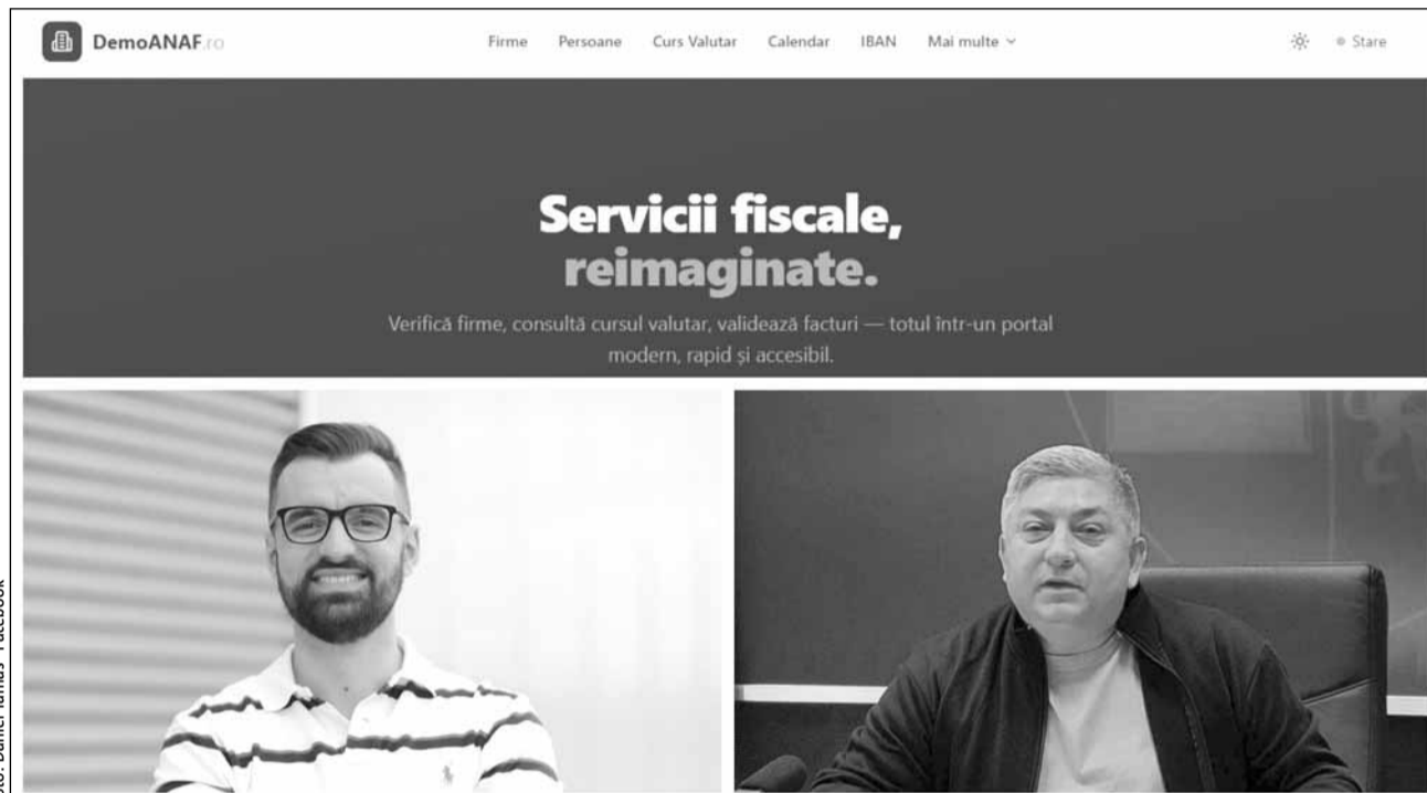
Consiliul Județean Cluj lansează un parteneriat cu creatorul demoanaf.ro pentru accelerarea digitalizării serviciilor publice

Cel mai recent pas în această direcție: un parteneri-