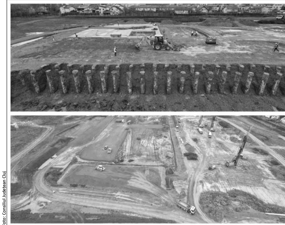
Lucrările pentru edificarea celei mai moderne unități spitalicești din România – Spitalul Pediatric au demarat în forță