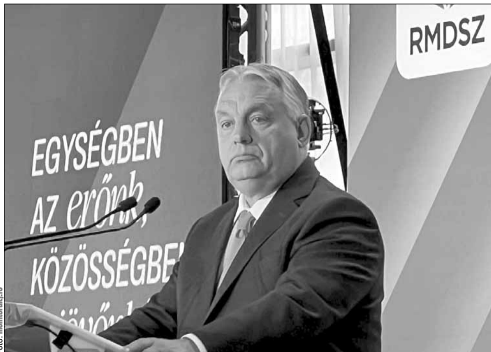
Prim-ministrul Ungariei, Viktor Orbán

În cei 16 ani la putere, Orbán a păstrat controlul complet asupra regulilor care guvernează