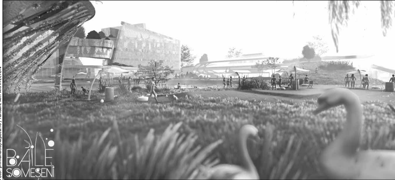
Foto: primariacuclujnapoca.ro / randare ART ARHITECTON Proiect Băile Someșeni

„Se pomenește că este legat de balnear. Ce este tematic la cămine, policlinici? Ponderea lor mi se pare mult prea mare. Căminele poate au legătură cu universitatea, pe care nu o văd în zonă pentru legătură. Cu excepția locuirii, încercați mixt. Nu. Tema este balnearul. Cum este pus în valoare? Conceptul pare un haos total. Nu v-ați orientat pe partea de intrare și ieșire din ansamblu. Trebuia să propuneți o stradă pentru largire. Nu este respectat caracte-