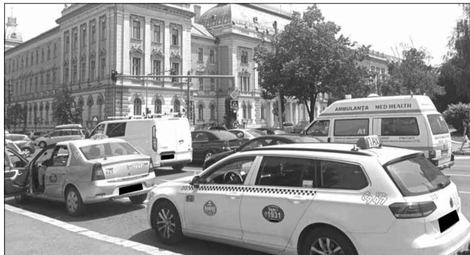
Taximetristii din Cluj-Napoca au dat în judecată Consiliul Local Cluj-Napoca

„Din 2021, toate taximetrele vor fi dotate cu POS, să