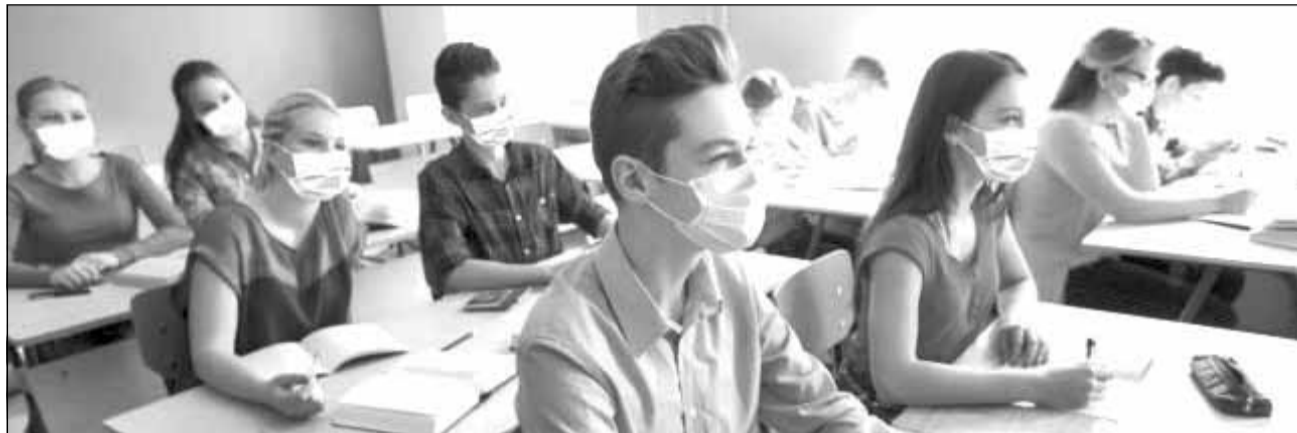
Elevii din Cluj sunt revoltați și cer măsuri clare în școli pentru că nu se simt în siguranță la ore

Elevii clujeni susțin că zeci de mii de semnături s-au adunat în doar 24 de ore fiindcă ei sunt sătuli să simtă nesiguranță, frică, anxietate și incertitudine. Petiția a fost realizată sub formă de „manifest adresat Ministerului Educației și Ministerului Sănătății”.