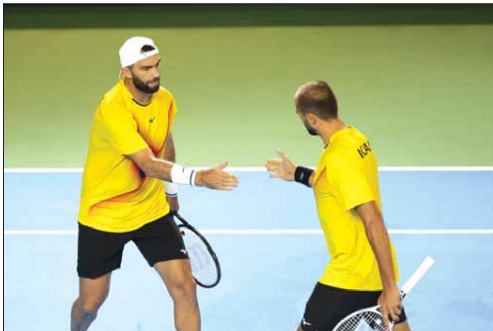
Horia Tecău și Marius Copil evoluând împreună într-o partidă disputată în Cupa Davis

Tecău, 36 de ani, s-a focusat în ultimii ani doar pe proba de dublu și a obținut rezultate admirabile. Sportivul născut la Brașov și-a atins de-a lungul anilor toate obiectivele importante și a decis să pu-