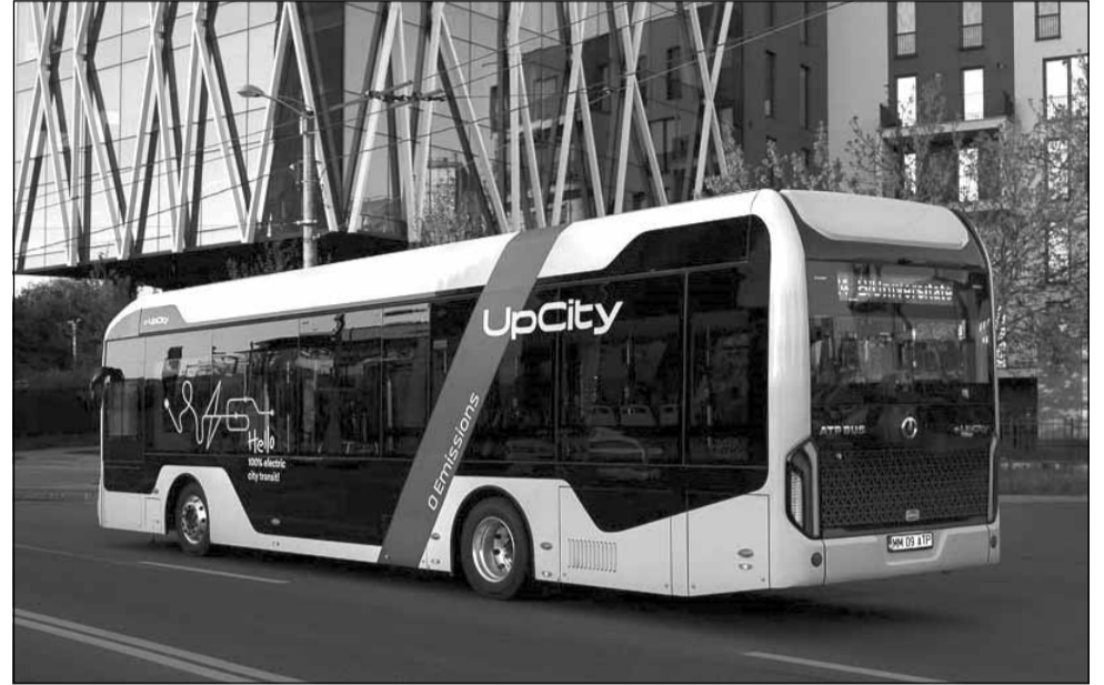
Străinii stabiliți în Cluj își doresc un oraș cu transport public complet electrificat

Printre temele avute în discuție în cadrul „Meet the Mayor” a fost și cea legată de sprijinirea domeniului HoReCa, puternic afectat de restricțiile impuse în contextul pandemiei de Coronavirus. Edilul a dat asigurări că, în completarea sprijinului acordat până acum, în 2022 este dis-