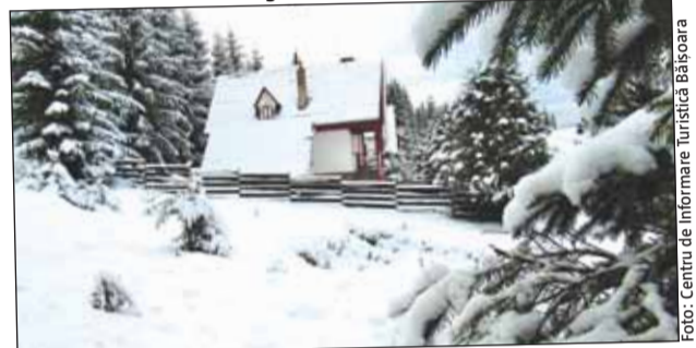
Troiene de zăpadă la Băișoara