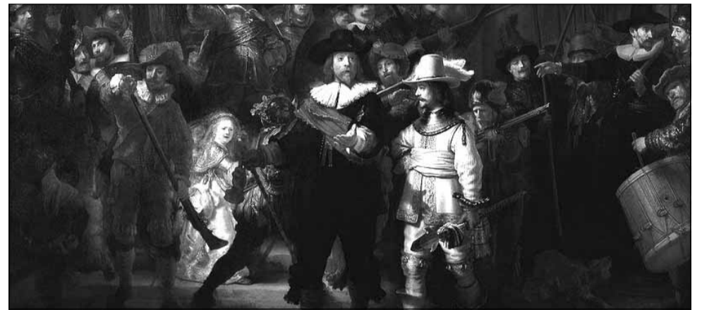
Rondul de noapte este considerat cea mai ambicioasă lucrare a lui Rembrandt

Rijksmuseum a prezentat miercuri rezultatele primei faze a acestor studii, care au obiectivul de a descifra și a înțelege tehnica artistului flamand și, pe termen lung, să îi redea acestei pânze monumentale strălucirea și splendoarea sa de altădată.