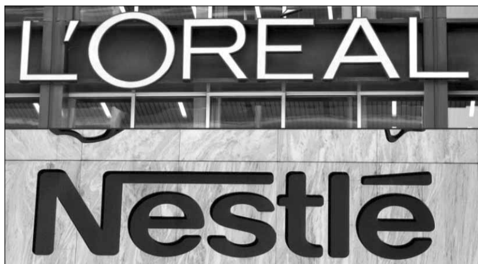
Nestle va vinde grupului francez L'Oréal un pachet de 22,3 milioane acțiuni proprii

Este pentru prima dată după 2014 când Nestle își reduce participația la L'Oréal, la acea dată grupul elvețian a strâns șase miliarde de eu-