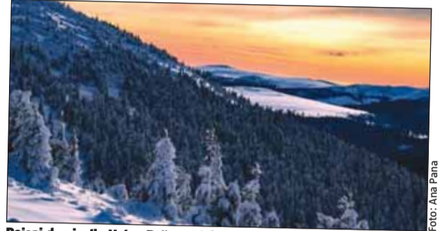
Peisaj de vis din Valea Drăganului

Nu evitați să apelați la salvamontiști pentru ajutor.