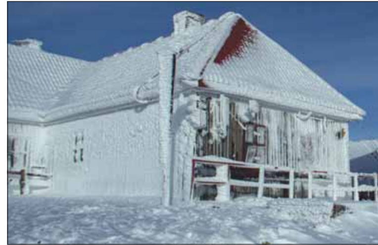
Stația meteo de pe Vârful Vlădeasa arată ca o căsuță de turtă dulce la începutul lunii

Este o localitate de vis pe care o străbate râul Drăgan. Valea Drăganului situată la 65 km de Cluj-Napoca