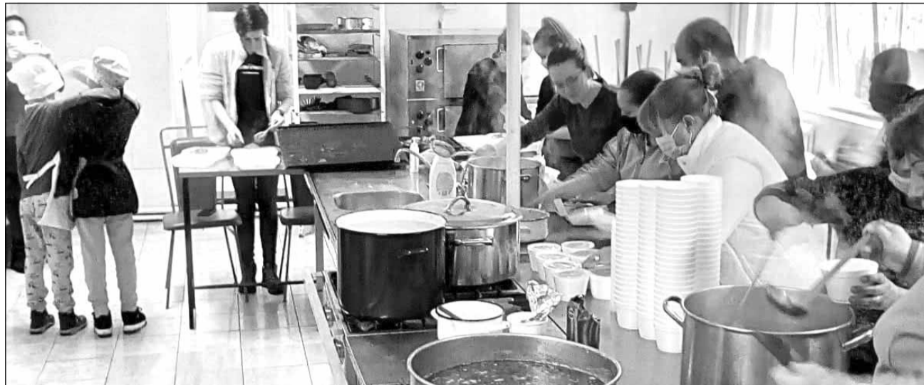
Clujenii care doresc să contribuie pot dona alimente neperisabile sau bani