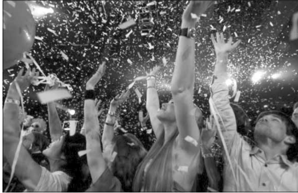
Restaurantele nu au limită de oră în noaptea de Crăciun și de Revelion, însă vor trebui să pună limită de 50% din capacitatea localului și să ceară certificatul verde COVID

„Pentru nopțile de Crăciun și Anul Nou – noaptea de 24 spre 25 și 31 spre 1 – nu vor fi restricții referitoare la ora până la care vor fi deschise restaurantele sau vor funcționa operatorii economici. Deci pot fi pe toată durata nopții, dar cu limită de 50% la locurile care pot