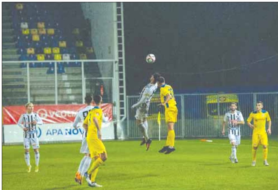
Universitatea Cluj a pierdut ultimul meci disputat în 2021 în Liga a 2-a

După o primă repriză încheiat 0-0, golul victoriei avea să vină în minutul 69. Petrolul deschide scorul după o