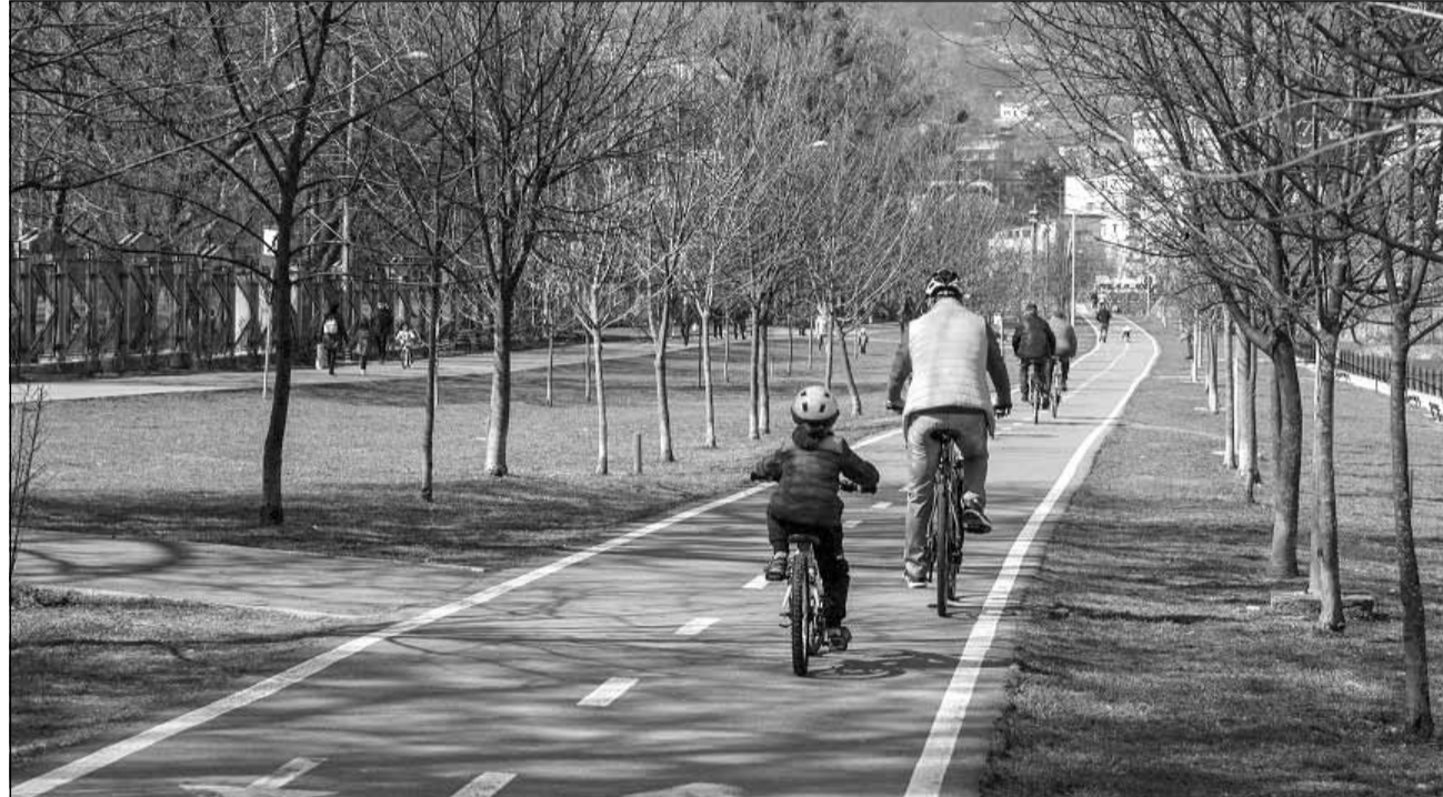
15 proiect au fost desemnate câștigătoare în cadrul procesului de bugetare participativă 2021

■ Educație rutieră pentru copii, minipoligon – 448 voturi Inițiativa propune ca, într-un parc public din municipiu, să fie amenajat un minipoligon,