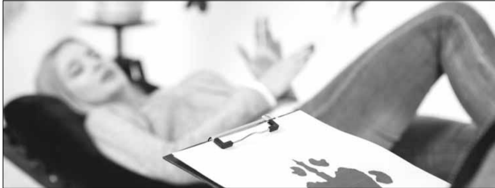
Zeci de specialiști din toată țara vor oferi ședințe gratuite de consiliere psihologică