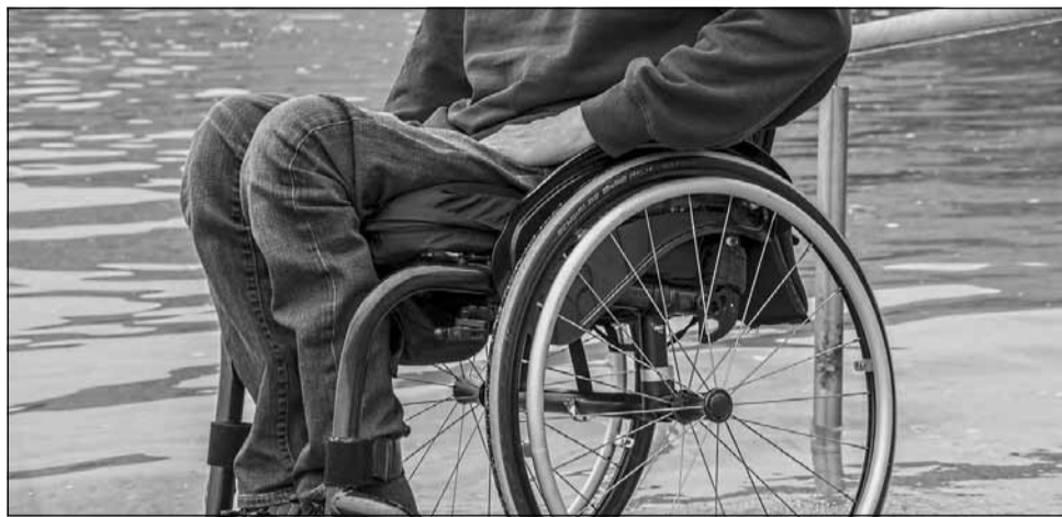
Scleroza multiplă este foarte probabil cauzată de virusul Epstein-Barr