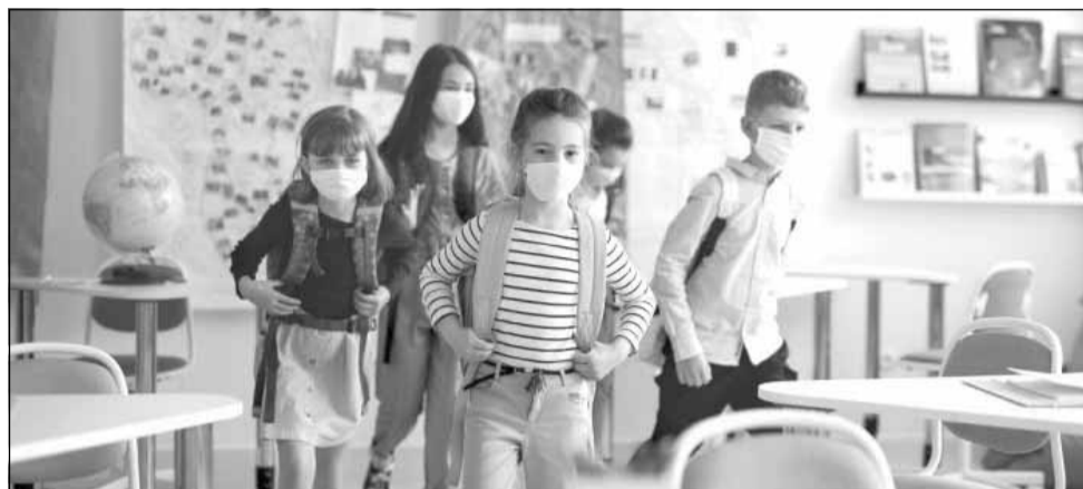
În Cluj-Napoca, 53 de școli, grădinițe și licee au cel puțin o clasă suspendată din cauza infecției cu COVID-19