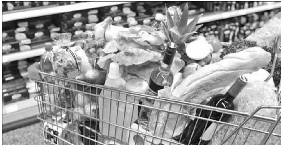
Scumpirile record din ultima vreme nu se vor opri nici în 2022, atenționează specialiștii

Carnea și laptele sunt mai scumpe cu aproximativ +4% față de începutul anului. Combustibilii s-au ieftinit cu -0,7% în decembrie față de noiembrie, dar sunt cu