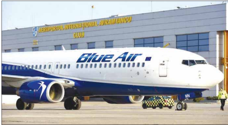
Compania aeriană Blue Air va opera zboruri din Cluj-Napoca spre cele mai populare destinații de la mare

„În ultimii doi ani, libertatea de a zbura ne-a fost luată tuturor, iar zborul a fost accesibil doar unui grup mic de persoane care au putut zbura către un număr limitat de destinații. Noi, la Blue Air, credem că am depășit cea mai grea perioadă și, luând în considerare tendințele de rezervare, clienții noștri se așteaptă ca restricțiile de călătorie să fie ridicate până în aprilie. Știm că pentru mulți oameni zborul este esențial, fie că este vorba despre reunitățile cu cei dragi, evadare departe de vremea rece, zile de naștere și aniversari, răsfăț cultural sau gastronomic sau pur și simplu relaxare la plajă - toate acestea au ne-au fost luate de ceva vreme. Noi, cei de la Blue Air, trăim pentru a zbura și zborul este în-