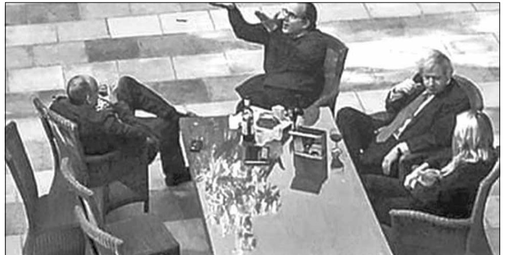
„Petreckerile de vineri”, un nou scandal pe lista ce i-ar putea aduce lui Boris Johnson sfârșitul politic

Publicația adaugă că personalul investise într-un fri-